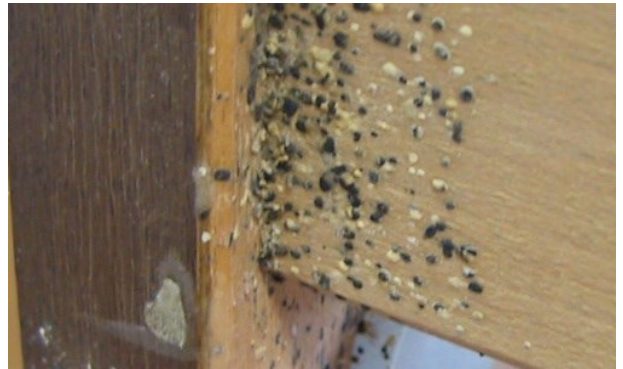
Izmet stjenica na podnicama kreveta jako zaraženog kreveta.