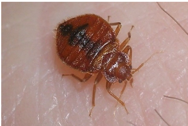
Odrasla stjenica pri sisanju krvi.