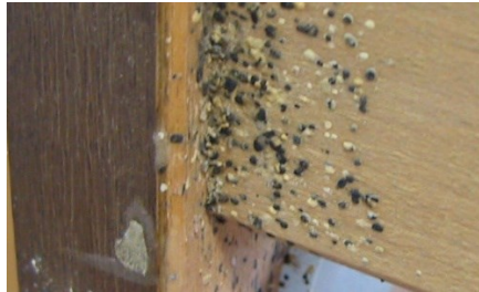
Excremento de chinches en el somier de una cama con una infestación grave.