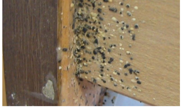
Ağır istilaya uğramış bir yatağın latalı somyası üzerinde tahtakurusu dışkısı.