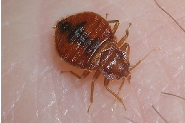
Kanla beslenen yetişkin tahtakurusu.