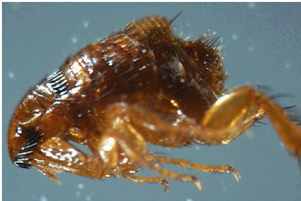
Ein Katzenfloh unter dem Mikroskop: Für die Unterscheidung von anderen Floharten sind die Kämmen hinter dem Kopf und vorne («Schnauz») wichtige Merkmale.

Der Katzenfloh ( Ctenocephalides felis ) ist 2 bis 3 mm gross, braun-schwarz gefärbt, seitlich abgeflacht und bewegen sich laufend im Fell der Tiere. Das hintere Beinpaar ist als Sprungbein ausgebildet, mit dem die Tiere bis 30 Zentimeter weit springen können. Ein Mensch müsste im Vergleich dazu über ein fünfstöckiges Haus springen.