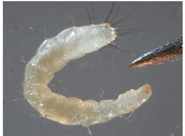
Die Larven ernähren sich vom Flohkot, sie leben nicht parasitisch. Der Kopf ist unterhalb der Pinselspitze, die zum Grössenvergleich abgebildet ist.

Larve: Bis 5 mm lang, weisslich mit dunkelgrau bis dunkelbraun durchschimmerndem Darminhalt. Beinlos, bewegt sich mit Hilfe von meist dunkel gefärbten Borsten und zwei höckerförmigen Fortsätzen am After vorwärts.