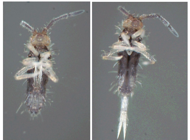
Ein Springschwanz unter dem Mikroskop: einmal mit Sprunggabel im Ruhezustand (links), einmal mit ausgeklappter Sprunggabel, mit der sich der Floh wegkatapultieren kann.

Manche sind Nahrungsspezialisten, z. B. Algen-, Moos- oder Pilzfresser, oder fressen sogar grüne Pflanzen. In einem speziellen Habitat leben die sogenannten Schnee- und Gletscherflöhe. Sie leben im Schnee und ernähren sich vor allem von Pollen oder Algen auf dem Schnee. Manchmal kann man sie zu Abertausenden an der Schneeoberfläche beobachten, sie bilden dort schwarze, sich bewegende Flächen.