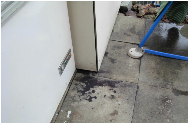
So genannte Schneeflöhe können sich in grossen Mengen auf dem Schnee ansammeln. Nach der Schneeschmelze war die Massenansammlung immer noch sichtbar.