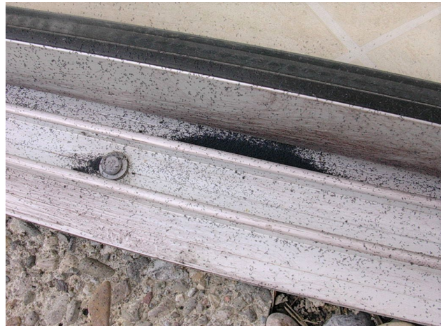
Massenansammlung von Springschwänzen auf einer Dachterrasse. Solche Mengen können bei hoher Bodenfeuchte auftreten und sind immer vorübergehender Natur.

Auf dem Flachdach lässt eine gute Dachentwässerung die Kiesschicht schnell austrocknen und verhindert eine Massenvermehrung von Springschwänzen.