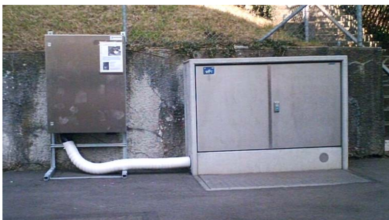
Beispiel BAK ab Verteilkabine

Die Installation ab dem Bauanschlusskasten ist durch eine Elektroinstallationsfirma auszuführen. Das Meldewesen durch die Elektroinstallationsfirma ist in jedem Fall einzuhalten! Installationsanzeige, Fertigstellungsanzeige und SINA sind bei ewz, Technik und Sicherheit, einzureichen.