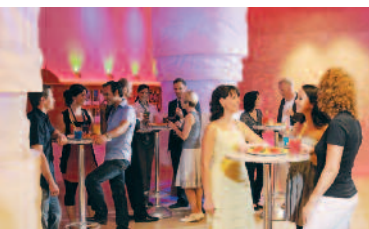
Ihr Event im ewz-Kundenzentrum.