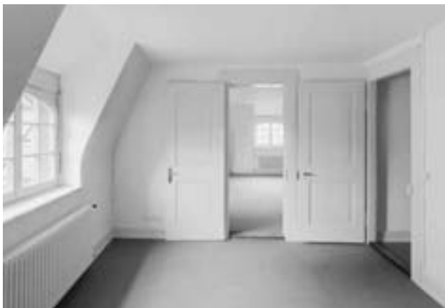
Marmorgasse/Kernstrasse: Wohnqualität mit vielfältigen Räumen.