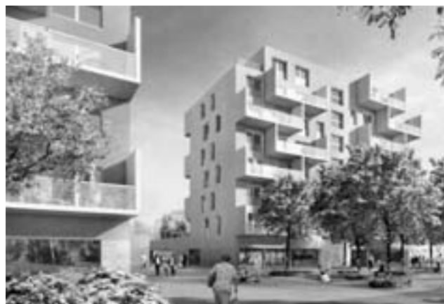
Die ersten Wohnungen der neu erstellten Alterssiedlung Frieden in Zürich-Affoltern der Stiftung Alterswohnungen werden ab Frühling 2011 bezugsbereit sein. (Visualisierung: pool Architekten, Zürich)