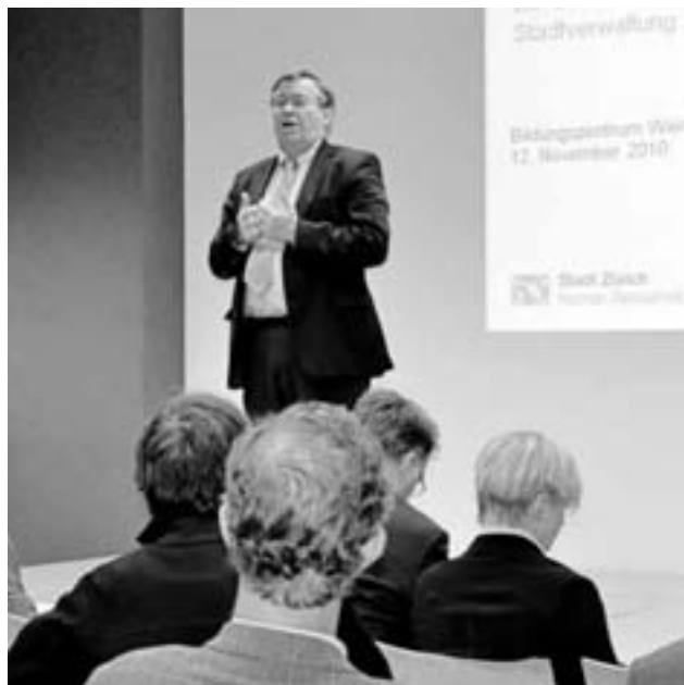
6. Zürcher Gesundheitsforum zum Thema «Demografische Entwicklung und Gesundheit der Mitarbeitenden der Stadtverwaltung».

Das Thema «Gesundheit» wurde überdies in das Zielvereinbarungs- und Beurteilungsgespräch (ZBG), in die Risiko-Checkliste «Betriebliches Gesundheitsmanagement» und in die neu konzipierte «StadtFührung» integriert. Die Checkliste bildet dabei einen Bestandteil des stadtweiten Projekts CHARM (Chancen- & Risikomanagement) und IKS (Internes Kontrollsystem) und wurde gemeinsam mit dem Case Management und der Fachstelle für Arbeitssicherheit und Gesundheitsschutz entwickelt. Neben der Vernetzung zwischen verschiedenen Fachstellen und Projekten fand wiederum ein intensiver Austausch zwischen den Verantwortlichen für BGF in den Dienstabteilungen statt.