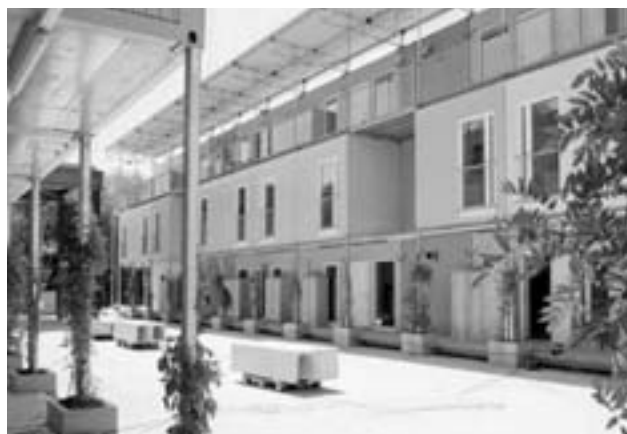
Containerdorf Leutschenbach: Innenhof mit Laubengängerschliessung.

Die Stadt kaufte von der Stadion AG (eine hundertprozentige Tochter der Credit Suisse) das Hardturm-Areal für 50 Mio. Fr. und erweiterte dadurch ihren Landanteil von 16311 m 2 auf 56243 m 2 . Mit diesem Landverkauf ermöglicht die Credit