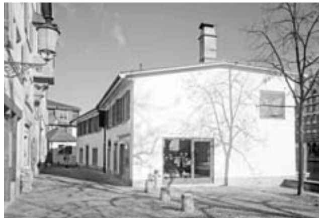
Schöpfe 24/26: Viel Licht und Platzbezug dank zwei neuen Fenstern in der Brandschutzmauer.

Um die Wohnungsnot bei den Studierenden zu lindern, baute die Stadt das ehemalige Wohnheim zu zwei Wohnungen mit je fünf Zimmern für Studierende um; im Erdgeschoss wurde eine Kinderkrippe eingerichtet. Die zehn Zimmer in unmittelbarer Nähe der beiden Hochschulen werden von der Woko (Studentische Wohngenossenschaft Zürich) je nach Grösse und Lagequalität alles inklusive zu zahlbaren 600–900 Franken pro Monat vermietet. Der historisch wertvolle, spätklassizistische Giebelbau gelangte im Jahr 1975 in städtischen Besitz und ist erstmals umfassend und nach denkmalpflegerischen Gesichtspunkten erneuert worden. (Baukredit: 2,8 Mio. Fr.)