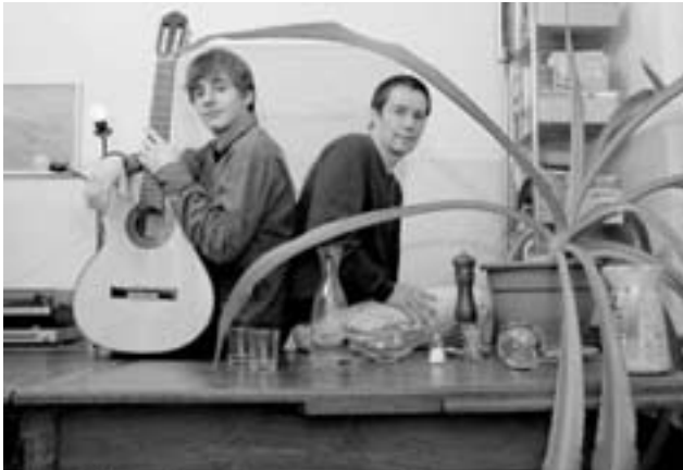
Bewohner der Wohnsiedlung Nordstrasse.