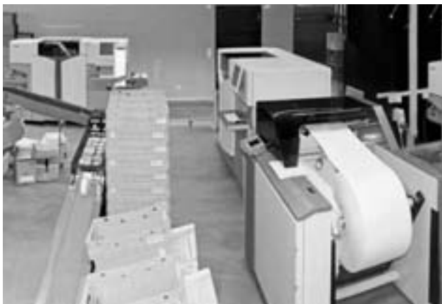
Das Steueramt verfügt über eine moderne Print-Center-Infrastruktur.

nach der wirtschaftlichen Leistungsfähigkeit jenem der Abschöpfung des unverdienten Wertzuwachses den Vorrang gegeben. Eine Volksinitiative regt zudem an, die geltenden Ermässigungen bei der Tarifierung für die jeweilige Besitzzeit einer Liegenschaft derart zu strecken, dass bei deren Annahme etwa 70 % des heutigen Steuerertrages wegfallen könnten.