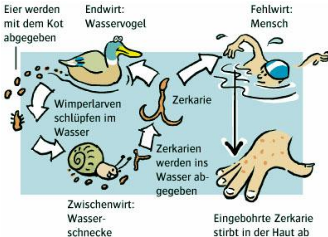
Lebenszyklus des "Entenflohs"

www.stadt-zuerich.ch/schaedlingsbekaempfung