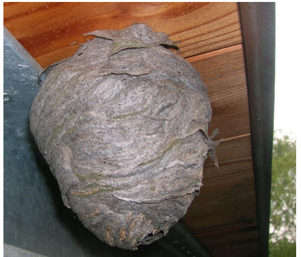
Nest einer Sächsischen Wespe unter Dachvorsprung

Das graue, meist frei hängende Nest in oder am Gebäude wird maximal Fussballgross. Das Nest hat meist die Form einer Erdbeere mit einer 1 - 2 cm grossen Öffnung seitlich im unteren Drittel.