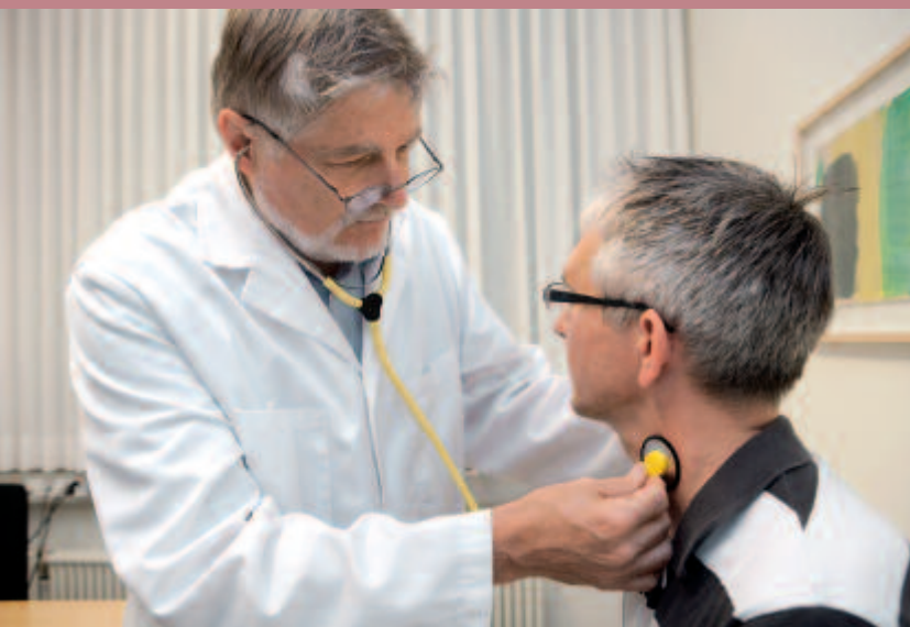
Abklärung in der Memory-Klinik Entlisberg

hören sowie zuweisende Stellen bei Fragen zu Demenz und anderen Gedächtnisstörungen. Dazu gehört die Memory-Klinik Entlisberg, eine Beratungs- und Abklärungsstelle für Menschen mit Gedächtnisstörungen und Demenz, die zum Ziel hat, Demenzerkrankungen frühzeitig zu erkennen und mithilfe von Präventionsmassnahmen zur Erhaltung von Gedächtnisleistungen beizutragen. Ein weiteres Angebot ist Hausbesuche SiL. Hier besuchen Fachpersonen der Pflege und Betreuung Klientinnen und Klienten zuhause, klären ab, ob es sich bei einer Gedächtnisstörung um eine Demenz handelt und zeigen Wege zur Alltagsbewältigung auf. Die Gerontologische Beratungsstelle vermittelt zudem ergänzende Angebote zur Pflege und Betreuung zuhause. Das sind flexible Aufent-