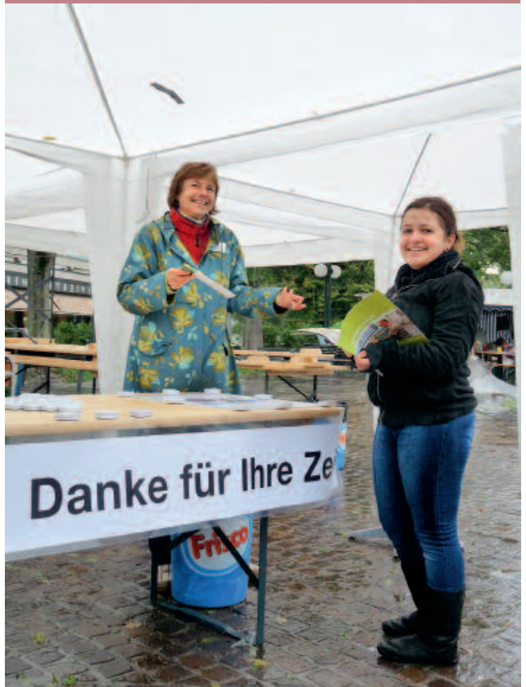
Gute Laune trotz schlechtem Wetter