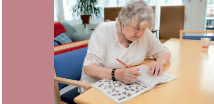
Unterstützung für die Pflege Zuhause: das Tageszentrum