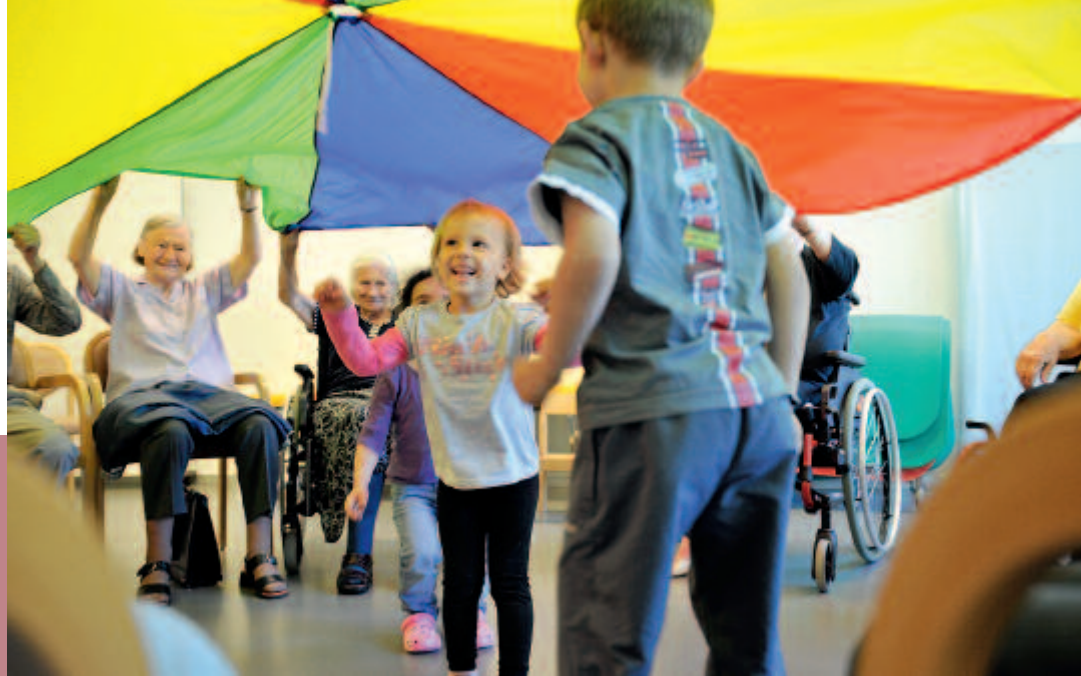
Begegnungen im Pflegezentrum Entlisberg