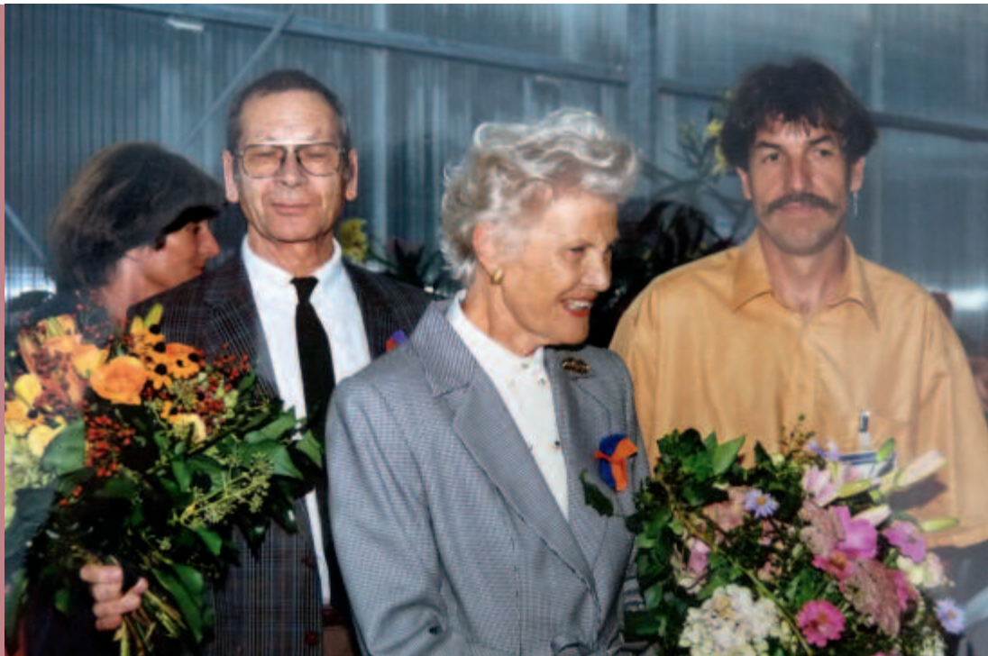
Auch das stand in der Hauszeitschrift: Erinnerungen an das grosse Seeblickfest 1999.