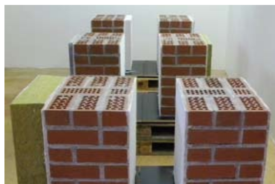
Bild 1: Aufspritzen HAGATHERM® Dämmputz Bild 2: Aussenwand mit 20 cm Mineralfaserdämmung Flumroc Compact gedämmt Bild 3: Wandschnittmuster im Massstab 1:1 in der Schweizer Baumuster-Centrale

gar nicht von aussen gedämmt werden. Gleiches gilt für die Innenseite bei reich verzierten oder besonders gut gestalteten Räumen.