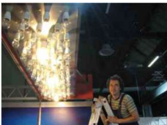
Die 2000-Watt-Lampe leuchtet auf Knopfdruck mit 20 100-Watt-Glühbirnen.

Wie viel ist 2000 Watt? Wie viel ist 6000 Watt? Die 2000-Watt-Lampe beantwortet diese Frage auf eingängige Weise. Auf Knopfdruck wechselt das Licht vom normalen Stromsparmodus zur Energieleistung bei 6000 Watt oder bei 2000 Watt. Die 2000-Watt-Lampe wird über der Theke montiert und leuchtet im Sparmodus mit drei Energiesparlampen, was eine zusätzliche Standbeleuchtung erübrigt. Die 2000-Watt-Lampe benötigt einen CE 16/380V Stromanschluss. Für den sonstigen Messestand genügt eine normale 220V-Steckdose.