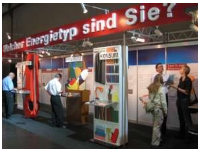
Der Energierechner an der LIFEfair Zürich, Mai 2008

Der Energierechner ist seit Mai 2008 im Einsatz. Unternehmen, Verbände oder die öffentliche Hand können den Energierechner zu kostendeckenden Preisen mieten.