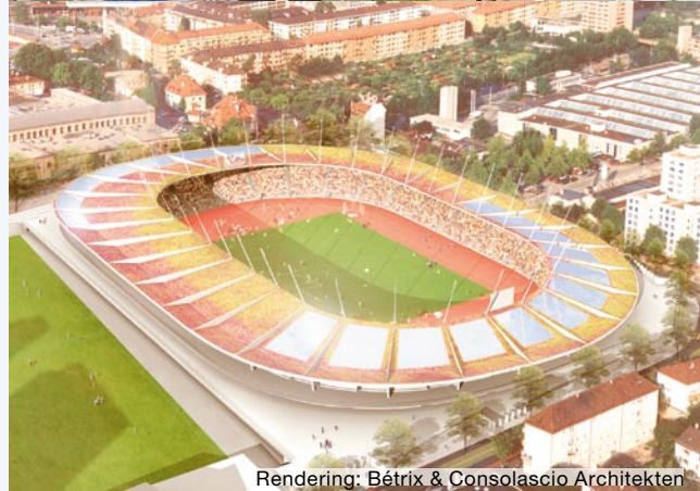
Rendering: Bétrix & Consolascio Architekten