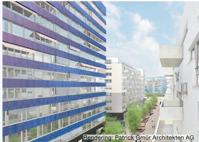
Rendering: Patrick Gmür Architekten AG

Verschiedene öffentliche und private Bauten sind im Letzigebiet geplant oder werden bereits realisiert, darunter grössere Wohnsiedlungen wie der 'Takt 9' an der Hohlstrasse oder die Überbauung 'James' an der Flüelastrasse. Parkanlagen und Schulhäuser im Hardaugebiet sowie der Neubau des Stadion Letzigrund ergänzen das vielfältige Bauprogramm.