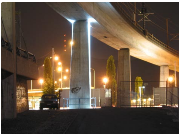
Bemusterung August 2004