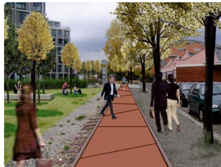
Park Tool beim West-Park mit Baumlager: vorher/nachher Foto und Visualisierung: Hager Landschaftsarchitekten