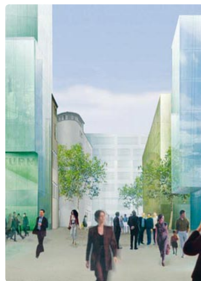
Visualisierungen und Modellfoto Maag-Tower · Maag Holding AG