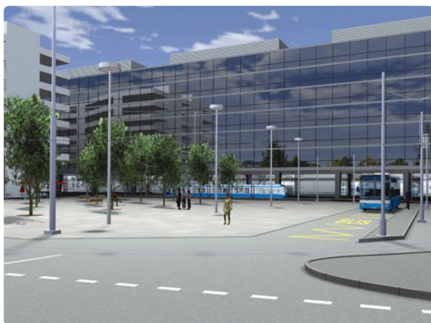
Bahnhof Altstetten · Visualisierung