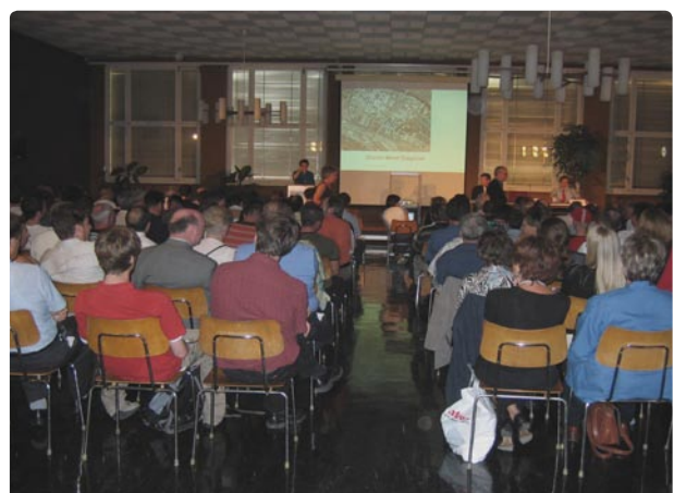
Fotos Zürich West Diagonal vom 7. September 2004