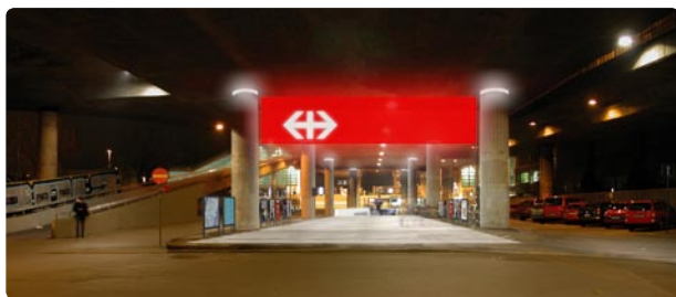
Visualisierung Sofortmassnahmen · EM2N Architekten