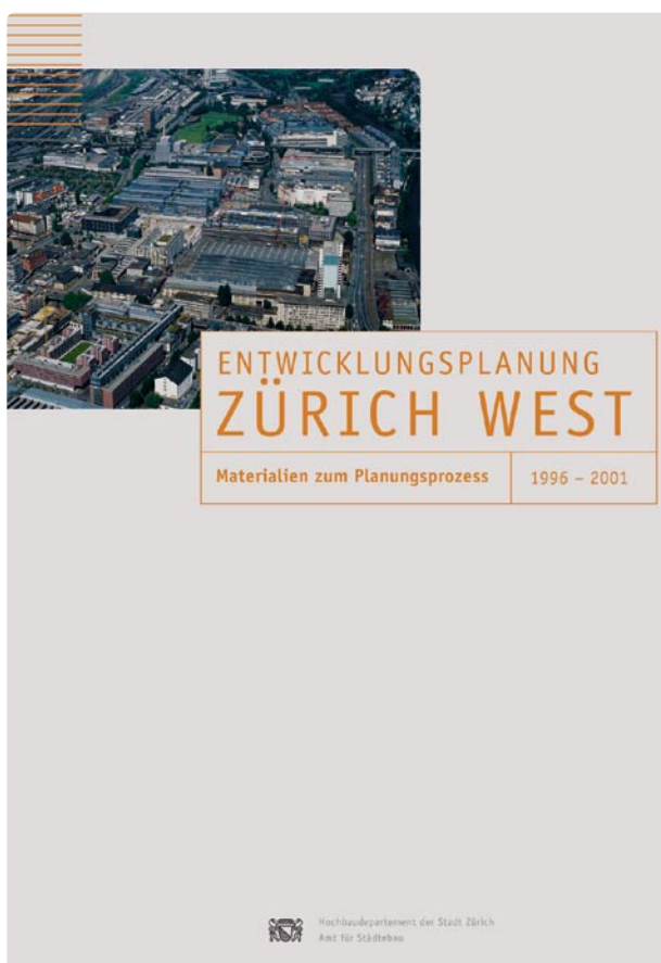
Planungsbericht · Titelblatt