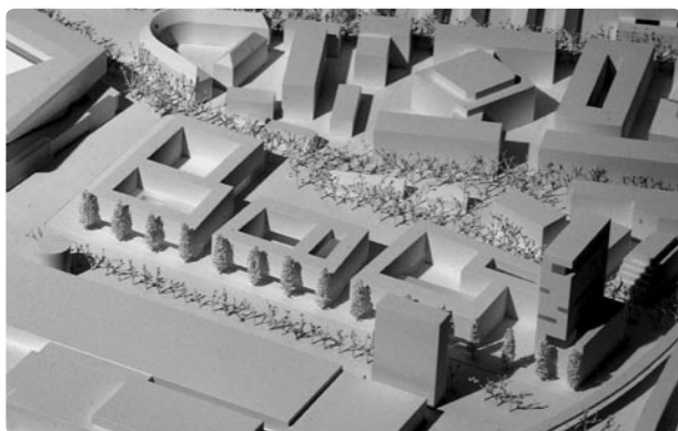
Hardturmareal · Modellfoto