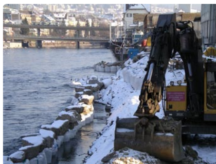
Baustellen Limmatauferweg und Limmatbrücke