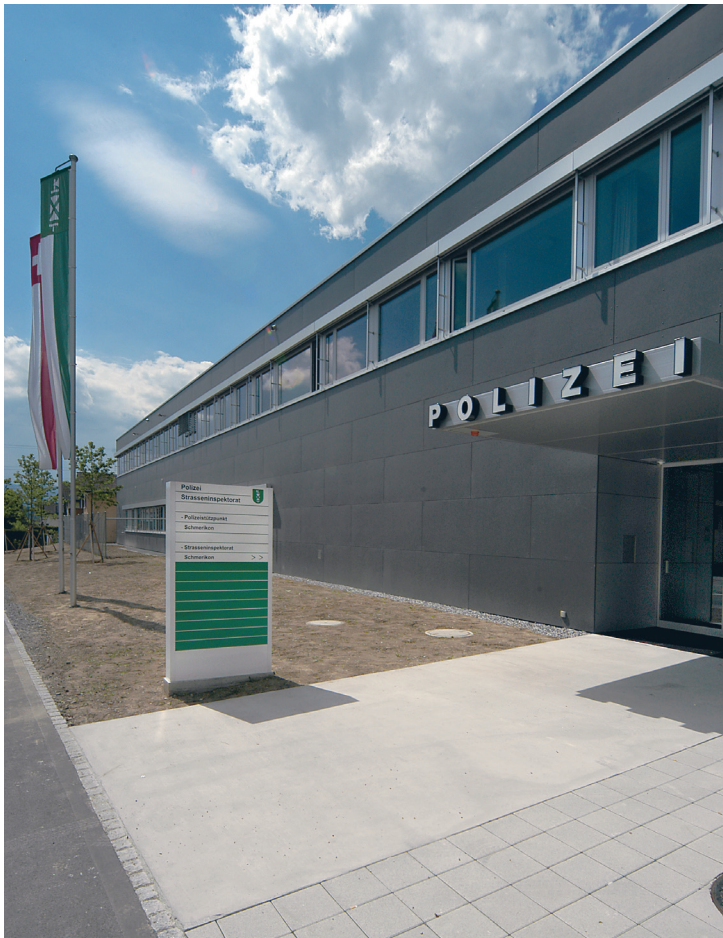
Der Polizeistützpunkt in Schmerikon wird voraussichtlich als einer der ersten Bauten mit dem Label »eco-bau« ausgezeichnet.

Es besteht die Möglichkeit, bereits nach der ersten Erhebung die Auszeichnung »eco-bau in Planung« zu beantragen – die eigentliche Auszeichnung mit dem Qualitätsstandard »eco-bau« erfolgt aber erst nach der Realisierung.