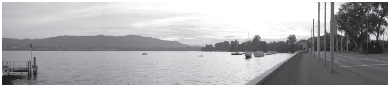
Beim Bahnhof Tiefenbrunnen berührt die Bellerivestrasse den See.

Weiter seeaufwärts sollen die öffentlich zugänglichen Bauten als Einzelereignis beleuchtet werden.