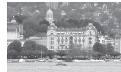
Stadtfassaden am See