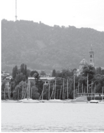
Die Kirche Enge und der Turm auf dem Üetliberg sind zwei Beispiele von Wahrzeichen des Seebeckens.