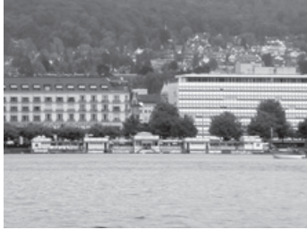
Die Badanstalt beim Utoquai als ein Ort auf dem Wasser.