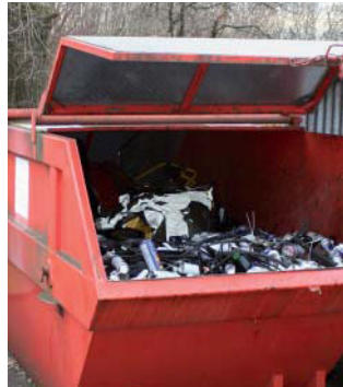
zwischengelagerte Abfälle in einer gedeckten Mulde

Auf öffentlichem und privatem Grund dürfen keine Abfälle im Freien abgelagert oder stehen gelassen werden. Dies gilt insbesondere für ausgediente Teile aus Metall oder Kunststoff. Abfälle sind entweder in gedeckten dichten Mulden oder unter Dach zwischengelagert. Abfälle, die mit wassergefährdenden Flüssigkeiten wie z.B. Öl oder Lösungsmittel verschmutzt sind, müssen in einer dichten, gedeckten Mulde oder in einem abflusslosen Raum gelagert werden.