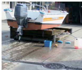
Waschplatz mit Anschluss an die Kläranlage

Abwässer aus Bootsreinigungen, Unterhaltsarbeiten etc. sind je nach Beschaffenheit vorzubehandeln und anschliessend in die öffentliche Schmutzwasserkanalisation einzuleiten. Das in die Kanalisation abfliessende Abwasser hat der eidgenössischen Gewässerschutzverordnung (GSchV) vom 28. Oktober 1998 zu entsprechen.