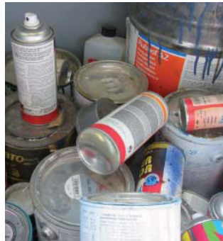
Sonderabfälle gehören nicht in den Kehrichtsack.

Bei Wartungsarbeiten fallen Sonderabfälle wie Altöle, Farbreste und -stäube etc. an. Schiffsbatterien, Reste von Farben oder Antifoulings können zur Entsorgung an die Verkaufsstelle zurückgebracht werden. Andere Sonderabfälle müssen aufgrund ihrer Zusammensetzung separat bei einem autorisierten Sonderabfallempfängerbetrieb entsorgt werden. Wir empfehlen, die entsprechenden Entsorgungsquittungen während mindestens fünf Jahren aufzubewahren. Ölhaltiges Bilgenwasser darf nur in dazu eingerichteten Häfen oder Bootswerften entsorgt werden.