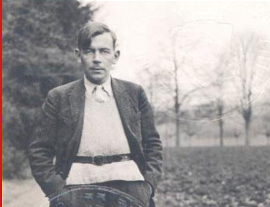
Friedrich Glauser (1896 – 1938), der Schöpfer des Wachtmeister Studer