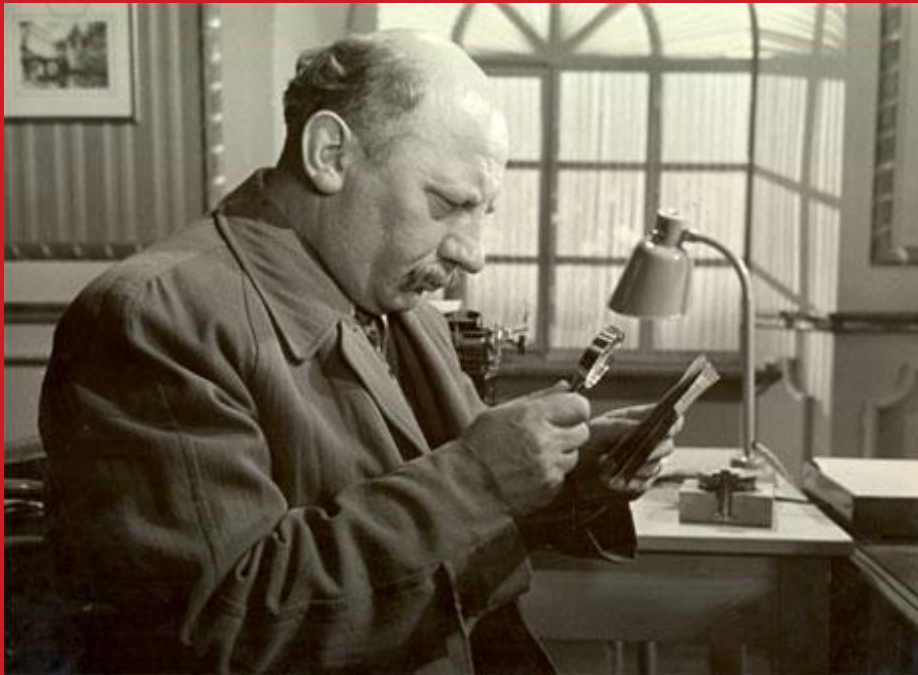
Heinrich Gretler als Wachtmeister Studer im gleichnamigen Film von Leopold Lindtberg (1939)

Stammbäume in einem Archiv – das überrascht nicht weiter. Tatsächlich würde Wachtmeister Studer im Stadtarchiv viele Unterlagen und Hilfsmittel finden, die ihm bei der Familienforschung helfen könnten. Doch wie ist Wachtmeister Studer ins Stadtarchiv gekommen?