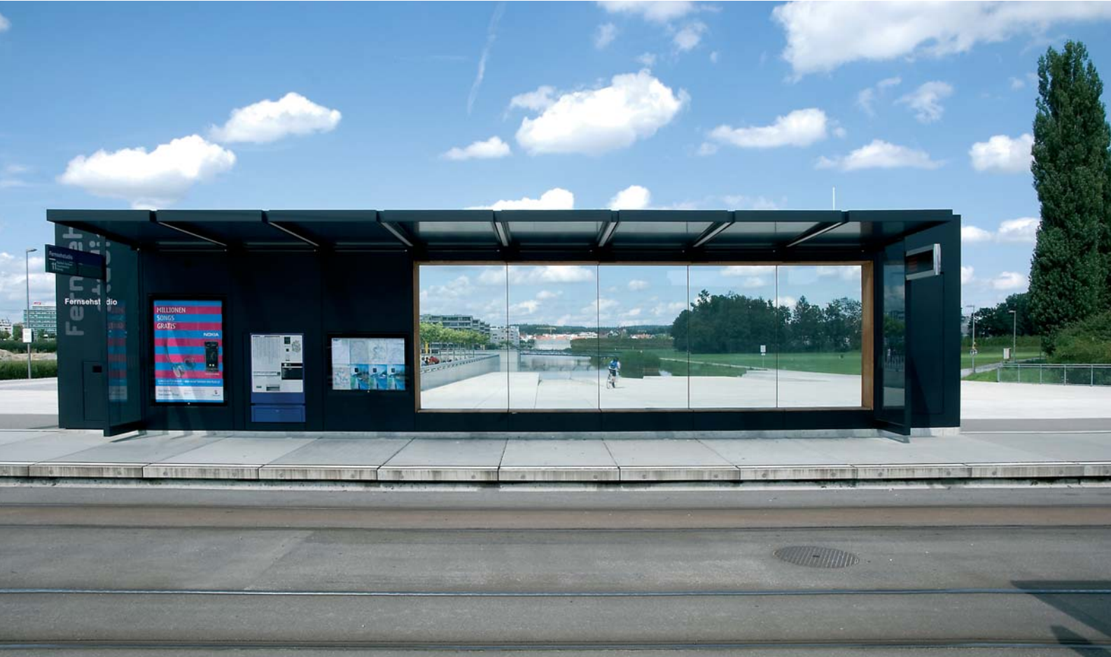
Haltestelle Fernsehstudio beim Glattpark, Opfikon.

regionale Zusammenarbeit? Bedeutet nun die «erstarrte» politische Zürcher Landkarte auch eine unbewegliche politische Landschaft?