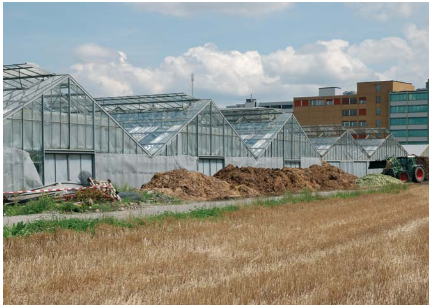
Grenzgebiet zwischen Zürich und Dübendorf.

Ebenso wenig, wie die Entwicklungsausrichtung der Grossstadt von den