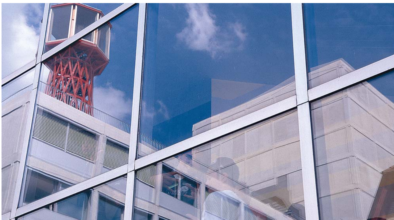
Technische Berufsschule Zürich, Kreis 5.

Über 80 Prozent aller EinwohnerInnen der Schweiz mit Migrationshintergrund leben in Städten und Agglomerationen. Es erstaunt deshalb nicht, dass der integrationspolitische Aufbruch gegen Ende des letzten Jahrhunderts von den urbanen Zentren ausging. Diesen stellten sich konkrete alltagspolitische Fragen, die mit den vorhandenen Ansätzen (die insbesondere gegenüber GastarbeiterInnen gestellte Assimilationsforderung