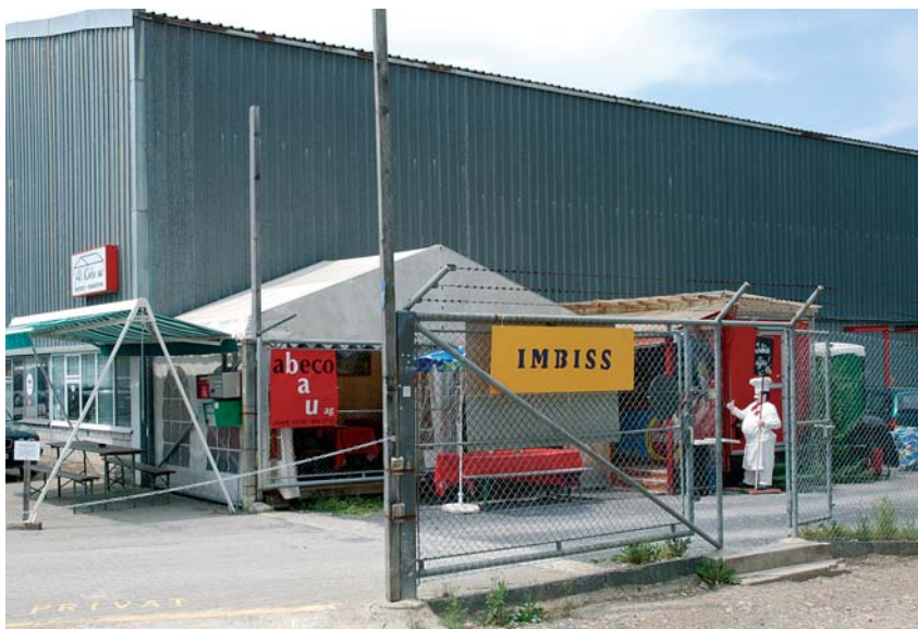
Gastronomie am Stadtrand.