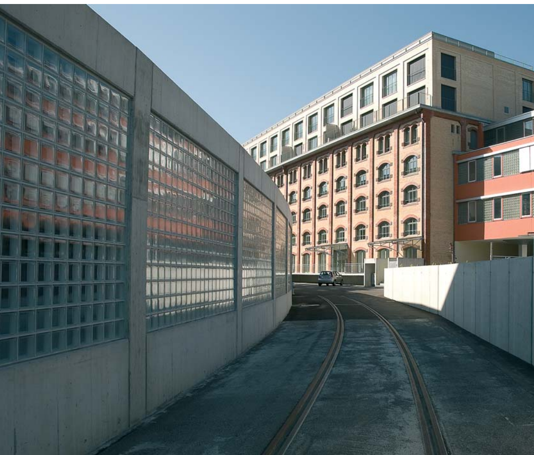
Beim Bahnhof Giesshübel, Wiedikon.

Um das Jahr 2000 wandelt sich das Bild: Im Zuge wirtschaftlicher und gesellschaftlicher Entwicklungen gewinnt das Städtische wieder an Attraktivität, in Zürich herrscht wohnpolitische Aufbruchstimmung. Dabei spielt die Stadt eine wichtige Rolle. Im Rahmen des 1998 vom Stadtrat beschlossenen Legislaturschwerpunkts «10 000 Wohnungen in 10 Jahren» werden verschiedene Areale im Baurecht an Genossenschaften vergeben und so dem Wohnungsbau zugeführt. 2002 wird der wohnungspolitische Legislaturschwerpunkt unter dem Titel «Wohnen für alle» thematisch erweitert, indem zusätzlich ein Augenmerk auf das Schaffen von Wohnraum für speziell unterstützungswürdige Zielgruppen – insbesondere alte Menschen und junge Leute in Ausbildung – gelegt wird. Im Verhältnis zwischen der Stadt und den anderen wohnpolitischen Akteuren hat ein neuer Geist der Kooperation und des Vertrauens Einzug gehalten. Bereits im Jahr 2000 werden gut 1500 neue Wohnungen fertiggestellt. Zwischen 1999 und 2008 werden 13 352 Neubauwohnungen realisiert, 54% davon sind Wohnungen mit mindestens 4 Zimmern. Zählt man die grossflächigen Wohnungen mit mindestens 100 m 2 mit dazu, handelt es sich bei fast 60% der neu gebauten Wohneinheiten um Grosswohnungen. Alleine in den Quartieren Affoltern, Seebach und Oerlikon entstehen