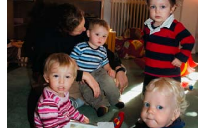
Betreuung, Förderung und Integration von Kindern im Vorschulalter