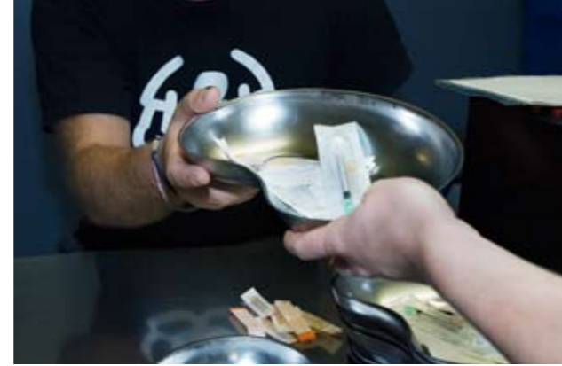
Prävention, Schadenminderung und Therapie