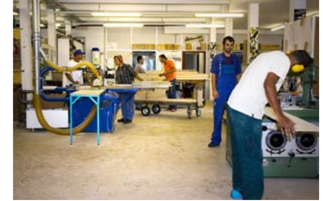
Arbeit, Beschäftigung und berufliche Integration