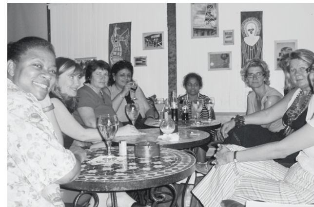
Genuss in der Bar: Selbstreflexion ist anspruchsvoll.

Lockere Sprüche zur Thematik Sucht wie: «Jetzt muss ich wieder meiner Sucht frönen», beim Griff zu Pausenkaffee oder -Zigarette hatten wir von keiner Moderatorin im Projekt FemmesTische je zu hören bekommen. Ist diese Thematik, trotz grossem Vertrauen in der Gruppe tabu? Zwei Moderatorinnentreffen 2006 nahmen sich explizit diesem Thema an. Die Frauen brachten ein Bild oder einen Gegenstand mit, bei dem ihnen massvoller Umgang schwer fällt. Mit Freundinnen telefonieren, Schönheitspflege, Kleider kaufen, Rauchen, Süssigkeiten, Fitness und Telenovelas wurden erwähnt. Die Moderatorinnen tauschten sich in Gruppen aus und beschrieben sich gegenseitig Situationen, in denen sie die Kontrolle verlieren. Sie berichteten über positive und negative Gefühle und schätzten ihr eigenes Risikopotential ein. Als Hausaufgabe nahmen sich alle vor, ein Verhalten zu stärken oder zu ändern. Die Hindernisse, die ihnen dabei begegneten, sollten sie genau beobachten. Der spätere Erfahrungsaustausch zeigte deutliche Änderungen und Überraschungen: Zwei Frauen hatten wahrnehmbar an Gewicht verloren. Eine von ihnen berichtete von tiefgehenden Veränderungen in ihrem Leben. Sie hätte sich mehr zurückgezogen, mehr mit sich selber beschäftigt.