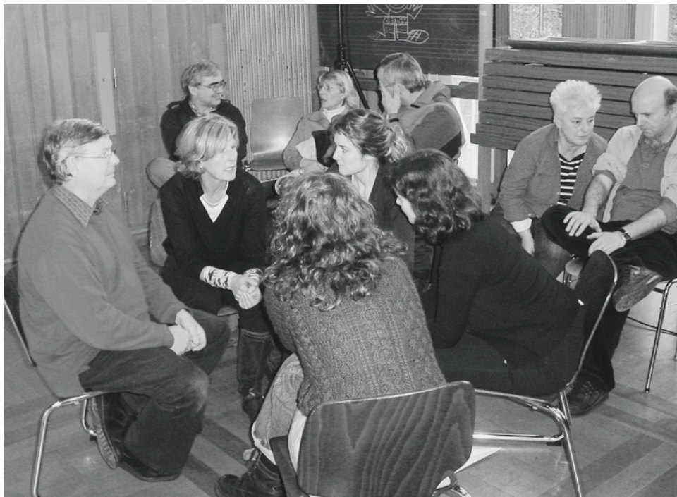
Austausch im Team des Schulhauses Rebhügel: Welche Regeln gelten an unserer Schule?

Im Rahmen des Projektes «Frühintervention – die Schulen handeln» der Stellen für Suchtprävention im Kanton Zürich wird seit Beginn des Schuljahres 06/07 mit vier unterschiedlichen Oberstufenschulen an einer guten Praxis in Sachen Frühintervention gearbeitet. Zwei der Schulen kommen aus der Stadt Zürich und werden von der städtischen Suchtpräventionsstelle in diesem Prozess begleitet. Nach intensi-