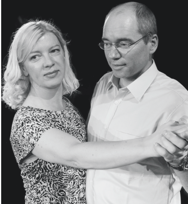
Ältere Generation: Ähnliche Träume, anders gelebt.

führt ein eigenes erfolgreiches Unternehmen und seine Frau arbeitet ab und zu im eigenen Betrieb mit. Deren Tochter ist auf dem Sprung ins eigene Leben und ihr Freund, ein Lernender im Unternehmen ihres Vaters, möchte am liebsten Fussballer werden. Dieses Beziehungsfeld gibt Raum für tausend Geschichten. Die Zuschauenden werden zu Teilnehmenden, hineingezogen in die knisternde Spannung gelebter und geträumter Phantasien. Die aufgestaute Emotionen können sich schliesslich im Publikum entladen, wer will darf selber auf die Bühne stehen und mit eigenen Ideen in das Geschehen eingreifen. «Traumprojekt» kommt seit der Premiere am 14. Juni 2006 in Schulen, Lehrbetrieben und Firmen zum Einsatz.