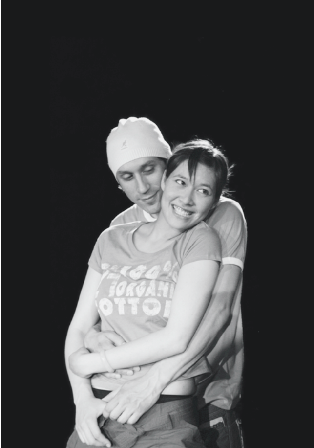
Junge Generation: Voller Träume und Visionen.

Wo erleben Sie in ihrem privaten oder beruflichen Leben Glücksmomente? Diese Frage stellten wir den über sechzig Teilnehmenden unserer Workshops zur Entwicklung eines Forumtheater-Stücks. Glücksmomente, die sich wie ein Schmetterling für einen kurzen, flüchtigen Moment niederlassen und dann wieder davon flattern. Hinter diesen magischen Momenten verbirgt sich eine Sehnsucht nach etwas Grösserem, nach dem über sich Hinauswachsen. Es ist die Suche nach Intensität und dem Ausseralltäglichen im eigenen Leben. Zum Beispiel drückt ein Kochlehrling dies so aus: «Ich will als Koch auf einem Schiff die Weltmeere bereisen.» Wie können Jugendliche eigene Visionen und Bedürfnisse überhaupt erkennen? In den Workshops wurden Glücksmomente in Skulpturen dargestellt, um Gefühle, die damit verbunden sind, sicht- und erfahrbar zu machen. Wie viel Risiko sind wir bereit einzugehen, um das Potenzial und die Kraft von Träumen zu leben, aber eventuell auch zu scheitern? Das ist nicht einfach in einem Umfeld in dem sich alles ums Vorwärtskommen dreht. Um Karriere, Erfolg, Wachstum und Fortschritt. «Ich mache nur Sachen, von denen ich