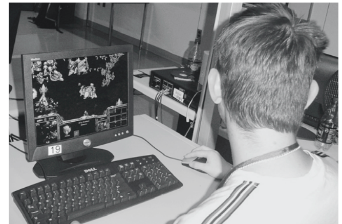
LAN-Party mit Starcraft-Spiel: Games faszinieren Jugendliche.

Die Hälfte der Schulärztinnen und Schulärzte stellt tendenziell auch einen Rückgang des Cannabiskonsums fest.