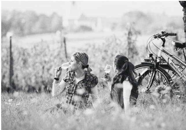
Verantwortungsbewusster Umgang: Genuss beim Weinkonsum