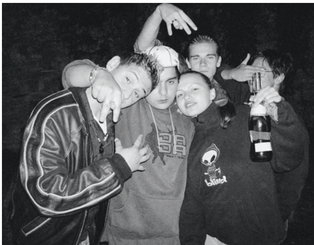
Konsumverhalten Jugendlicher: Riskant Konsumierende im Fokus der Alkoholprävention

Eines davon ist das wissenschaftlich begleitete Pilotprojekt «Kurzinterventionen bei risikoreich Alkohol konsumierenden Berufs- und Mittelschülerinnen resp. -schülern». Träger dieses Projektes sind das kantonale Mittelschul- und Berufs-