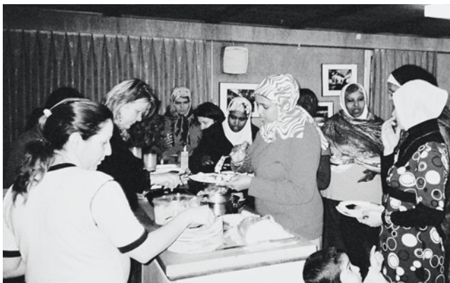
Gemeinsam Feste feiern: Netzwerke sind wertvoll

gibt, wie z.B. zu Ausgang und Suchtmittelkonsum, die sich allen Eltern stellen, egal aus welcher Kultur sie kommen. Unterschiedlich ist eher die Art, wie Eltern darauf reagieren. Und da können die Mütter ihre Handlungskompetenz erweitern. Diese Runden, die etwa viermal jährlich zu unterschiedlichen Suchtpräventionsthemen stattfinden, fördern auch die Beziehungen und die Nachbarschaftshilfe unter den Familien. Neue Netzwerke entstehen. In der Baracke Auzelg treffen sich die Frauen am Freitagabend noch einmal. Diesmal ist es ein Frauenfest mit Musik, Essen und Tanz. Und die Töchter sind dazu eingeladen.