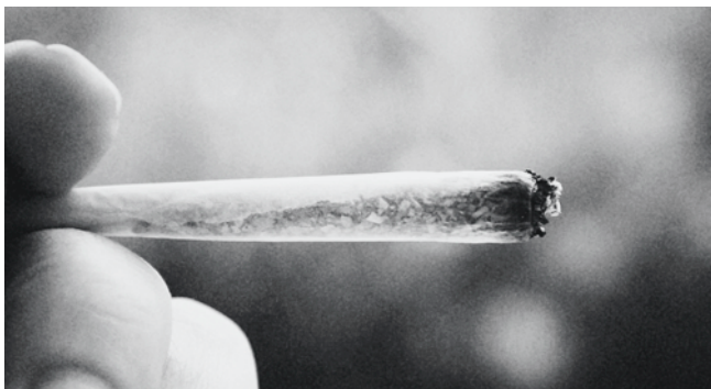
Illegaler Cannabiskonsum: Anlass für eine Verzeigung

können die Gruppengespräche bei den verzeigten Jugendlichen, die sich in einer kritischen Phase befinden, kleine Kurskorrekturen bzgl. Weiterentwicklung bewirken.