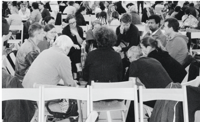
Austausch unter Eltern: Vieles was beschäftigt, ist interkulturell

Damit wir Migranteltern mit Suchtpräventionsthemen erreichen, arbeiten wir seit Jahren mit interkulturellen Vermittlerinnen und Vermittlern zusammen. Bei Bildungsanlässen, die über die Schule oder andere Institutionen angeboten werden, übersetzen sie die Einladungen, stellen sich vor und offerieren, am Elternabend dabei zu sein. Manchmal werden Eltern zusätzlich telefonisch oder persönlich eingeladen. Durch Empfehlungen und verschiedene Projekte, lernen wir laufend neue Vermittler/-innen kennen. Mittlerweile sind es zwanzig Leute für 14 Sprachen. Sie sprechen gut deutsch, sind der schweizerischen Kultur gegenüber aufgeschlossen und integriert. Ausserdem pflegen sie guten Kontakt zu ihren Landsleuten und bringen Eltern, mit erschwertem Zugang zu Bildung, Verständnis und Wertschätzung entgegen. Durch gemeinsame Erarbeitung neuer Themen integrieren wir die Sichtweisen anderer Kulturen und machen die Übersetzer/innen zu Verbündeten, die unsere Haltung und unsere Botschaften mittragen. Zudem sollen die Zielsetzungen, Botschaften und Inhalte für die Eltern verschiedener Ethnien verständlich und von ihnen wertschätzend aufgenommen werden. Manche Inhalte sehen für Migranteltern etwas anders aus.