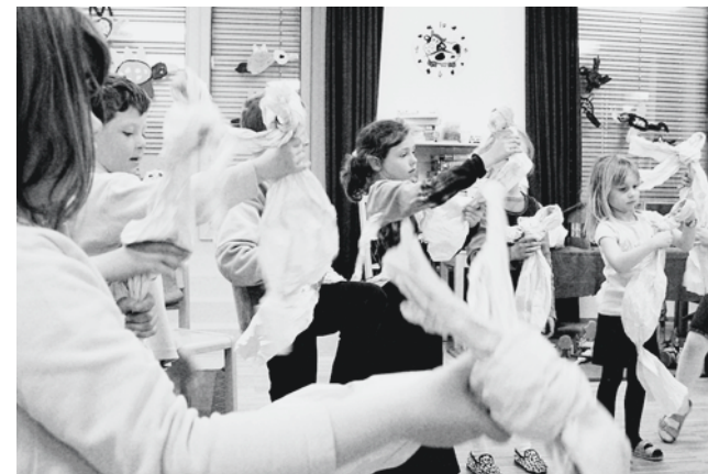
Figuren aus Papier formen: Langeweile weckt Kreativität

Am Eltern-Informationsabend sensibilisieren die Suchtpräventionsstelle und die Lehrpersonen für das Thema «elektronischer Medienkonsum und Langeweile» und stellen das Theaterprojekt vor. Im eigentlichen Theaterstück erleben die Kinder zusammen mit dem kleinen Drachen, wie man, vertrauend auf seine eigene Stärke, eine vermeintlich