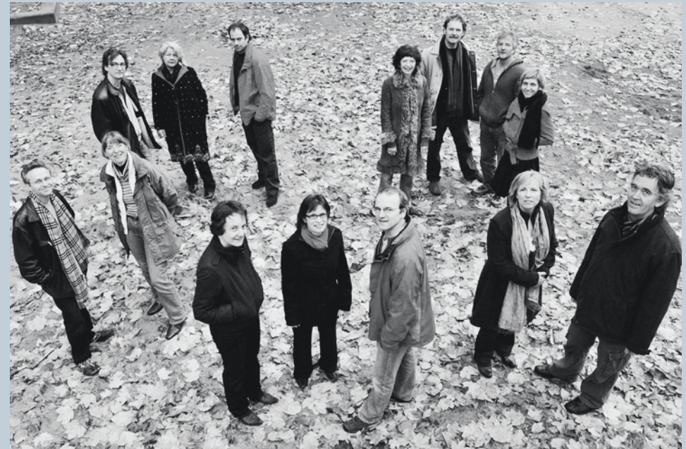
Vorne, von links nach rechts:

Folgende Mitarbeitende haben 2008 bei der Suchtpräventionsstelle gearbeitet.