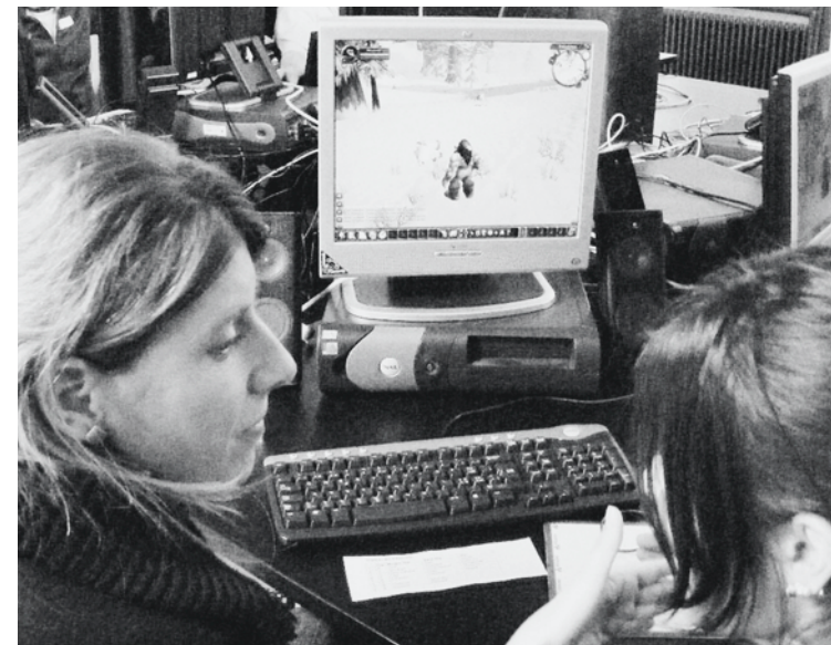
Einblick in eine andere Welt: Jugendliche erklären World of Warcraft

Den Teilnehmenden standen für die praktischen Angebote