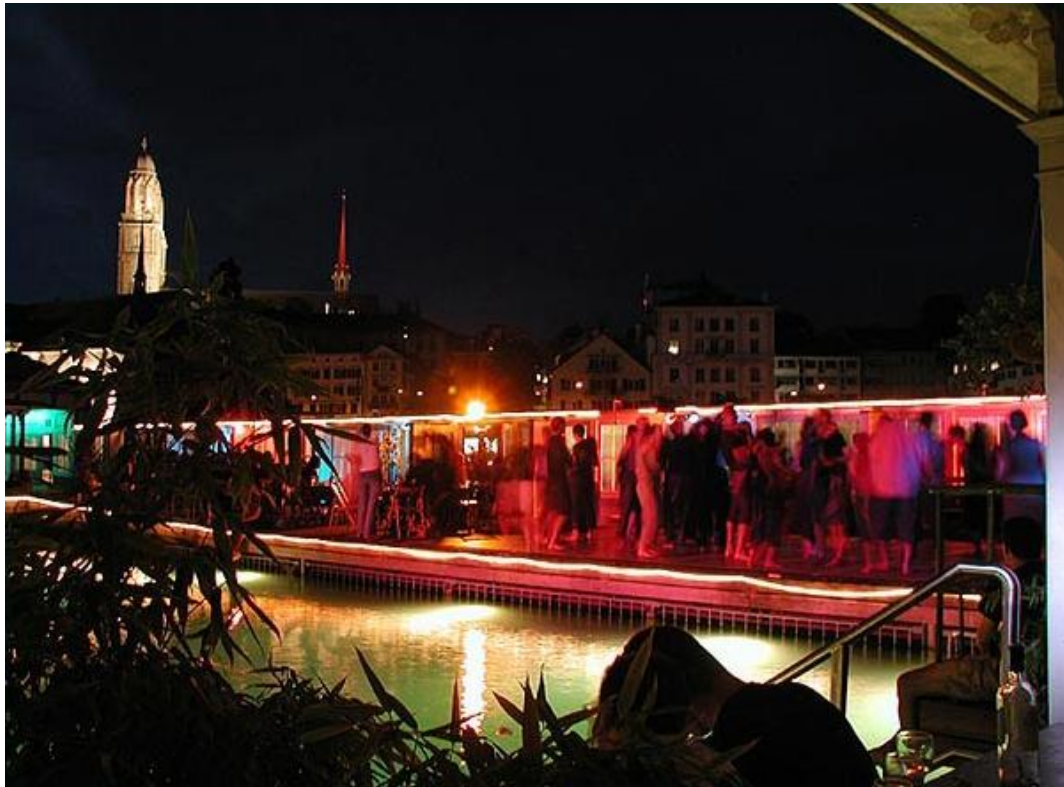
Barfussbar im Frauenbad Stadthausquai

Auch die Angebote haben sich mit den Bedürfnissen der Zeit entwickelt, moderne Gastronomie, Yoga, Massage, Kinderspielnachmittage. Der Einzug der Partykultur erfüllt die Bäder auch nachts mit Leben, Openair-Kino, Bars, Theatervorführungen, Tanz und vieles mehr.