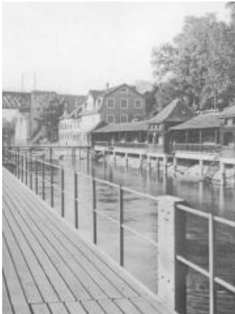
Flussbad Unterer Letten

Mit Einzug der Körperkultur des 20. Jahrhunderts, hielt man sich im Bad nicht mehr vorwiegend im Wasser auf, der Aufenthalt an der Sonne und an der Luft wurde gefördert. So entstand ein neuer Bädertyp. Das erste Sonnen- und Luftbad war das Flussbad Unterer Letten. Die Regel, den Badeaufenthalt auf eine Stunde zu begrenzen, wurde aufgehoben. Neu wurde auch die Topographie des Ortes mit in die Infrastruktur einbezogen.