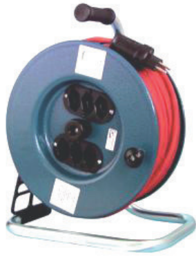
220V Kabelrolle 50m