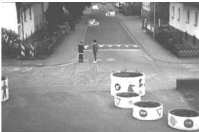
Die Waldstraße nachher