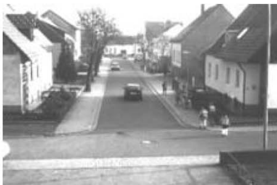
Die Waldstraße vorher