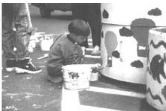
Künstler bei der Arbeit