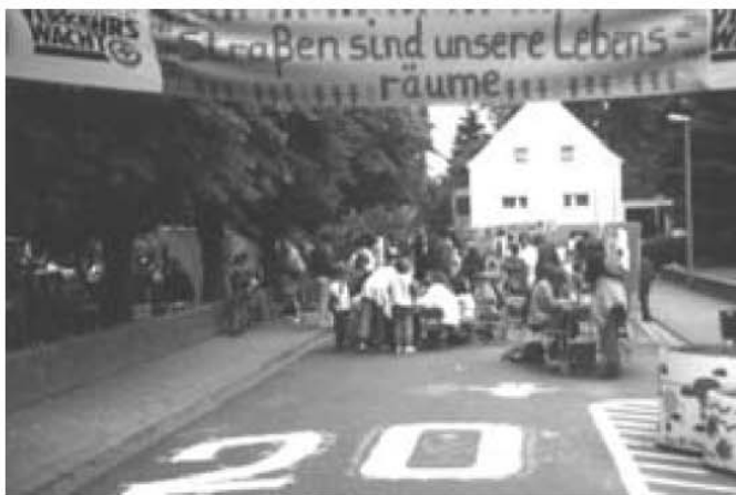
Abschluß und Höhepunkt der Projektwoche: Das Schulfest auf der neu gestalteten Straße – eine Tempo-20-Zone