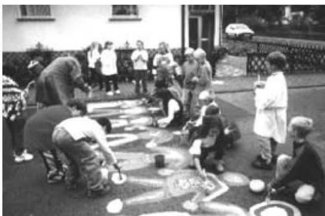
Die Aktion lebt auf: Jährlich werden von den Kindern der GS "St. Bonifatius" die Malarbeiten erneuert.