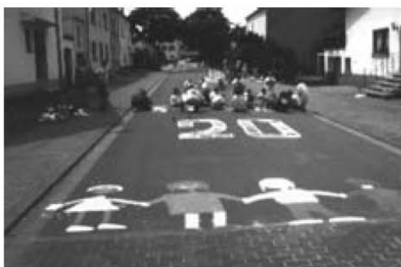
Die Straße bekommt ein neues Gesicht; die Handschrift der Kinder ist schon nicht mehr zu übersehen.