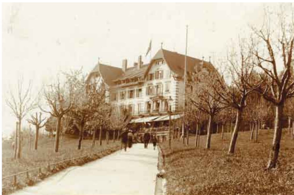
Prägend für das Landschaftsbild am Susenberg: Der Obstgarten des Hotels Zürichberg um 1910.

In einer gemeinsamen Aktion haben das Sorell Hotel Zürichberg der ZFV-Unternehmungen und Grün Stadt Zürich am 21. November 2006 den Obstgarten Susenberg wieder auf 100 Bäume aufgestockt. Damit wird das Landschaftsbild wieder das Gepräge des Zustands vor hundert Jahren erhalten.