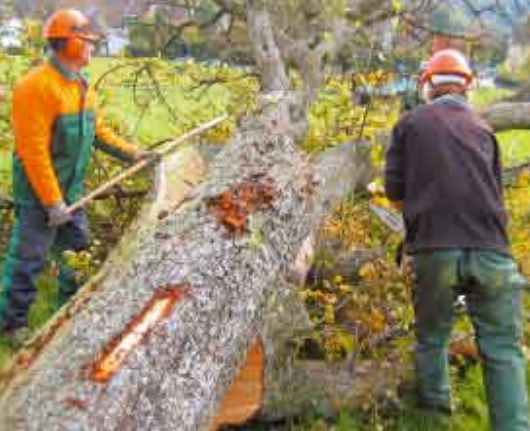
Mitarbeitende des Juchhofs beim Roden der alten Bäume.