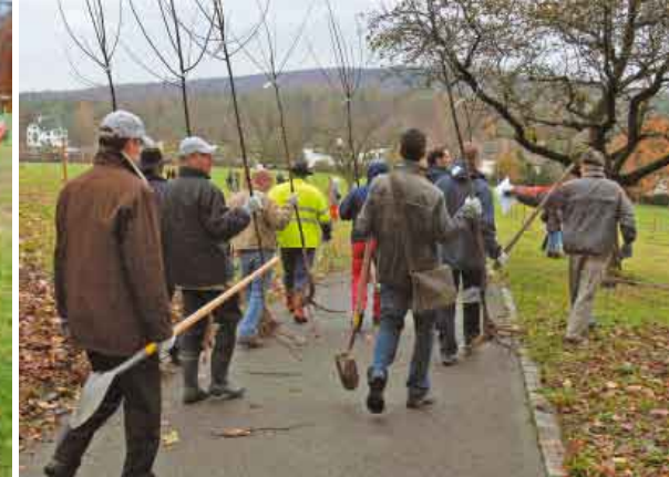
Nach dem Fassen von Baum und Schaufel marschieren die Baumpatinnen und Baumpaten los zum ausgesteckten Obstgarten.