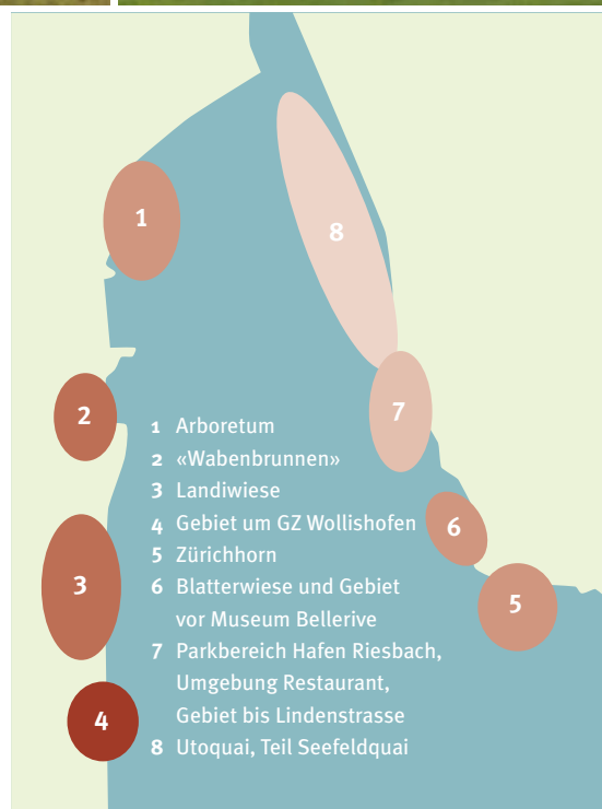
Anzahl der städtischen Besuchenden nach Sektoren

Im Lauf des letzten Sommers befragten die Sozialgeografin Sara Landolt und die Stadtplanerin Stephanie Schneider an acht verschiedenen Orten in den öffentlichen Parkanlagen rund um das Seebecken insgesamt 521 Personen eingehend nach Herkunft, Häufigkeit der Besuche am See, Art der Aktivitäten und Zufriedenheit mit Infrastruktur und Pflege der Anlagen. Aber auch Störfaktoren und Mängel wurden erfragt. Über einige Resultate der umfangreichen Studie staunten sowohl Auftraggeber als auch die Forscherinnen selbst. «Beeindruckt hat uns vor allem die grosse Toleranz im Umgang mit möglichen Störfaktoren, zum Beispiel «wilden» Grillstellen oder freilaufenden Hunden», meint Landolt, und Schneider ergänzt: «Offenbar gehen