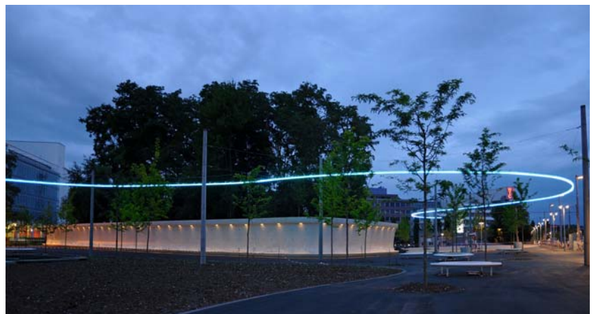
Der Leutschenpark mit Baumtopf und Leutschenlicht.

Ende 2008 befanden sich insgesamt 46 Projekte in Bearbeitung. Die Investitionen werden wegen der Verzögerung mehrerer Projekte wesentlich unter dem Budget liegen.