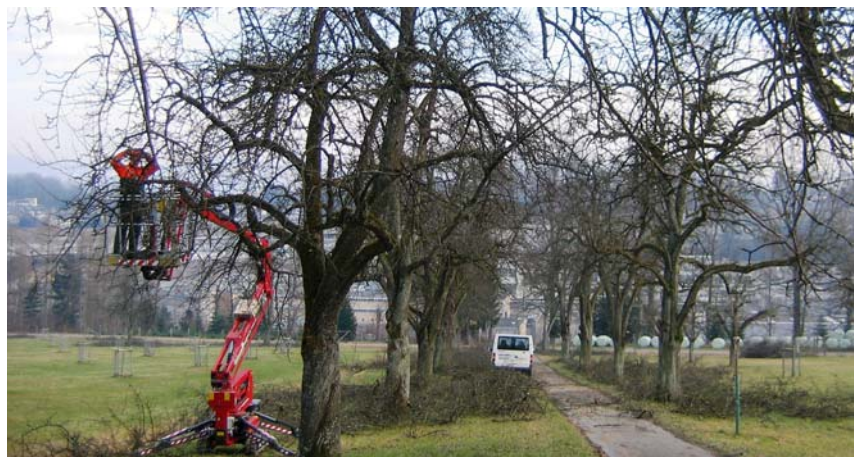
Obstbaumschnitt in der Allmend Brunau.

Aufgrund eines Defekts musste im Sommer 2008 die Ölheizung der Stadtgärtnerei sofort ersetzt werden. Die neue kombinierte Holzpellets-Gas-Heizung wurde im Herbst in Betrieb genommen.