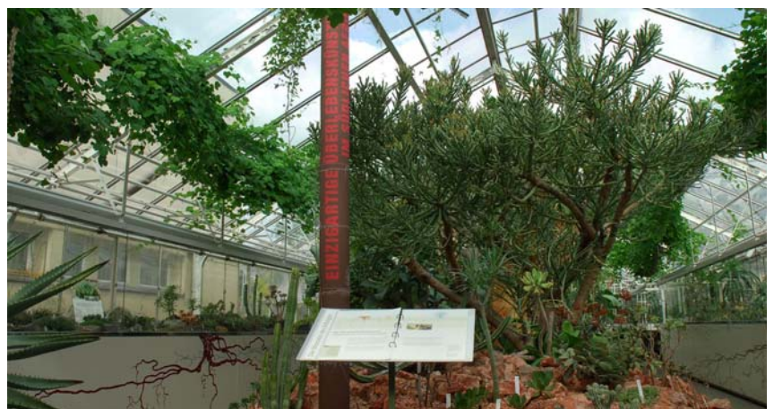
Einzigartige Überlebenskünstler im südlichen Afrika.

Ausstellungen Im Naturzentrum Sihlwald, in der Stadtgärtnerei und der Sukkulente-Sammlung wurden wiederum Sonderausstellungen präsentiert. Die Stadtgärtnerei führte zum dritten Mal die Zürcher Orchideentage mit Orchideenbörse in Zusammenarbeit mit dem Regionalverein Zürich der Schweizerischen Orchideengesellschaft durch. Die Sukkulente-Sammlung präsentierte das Thema «Einzigartige Überlebenskünstler im südlichen Afrika».