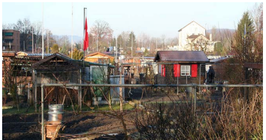
Das Familiengartenareal «Bähndli».

Temporäre Vermietungen Die rege Bautätigkeit in der Stadt Zürich führt zu einer grossen Nachfrage nach Bauinstallationsplätzen. Diese generieren zwar einen erheblichen Verwaltungsaufwand, gleichzeitig aber auch einen guten Ertrag, vor allem im Vergleich zu den ordentlichen Verpachtungen, die sich aus rechtlichen oder gesellschaftspolitischen Gründen durch sehr günstige Pachtzinse auszeichnen.