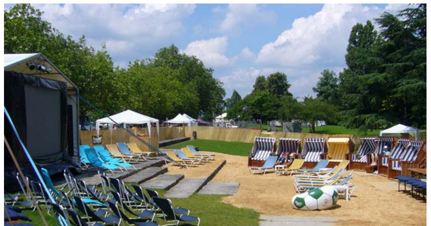
Euro 08 am Hafen Riesbach.

Parkanlagen Die durch die Euro 08 in Mitleidenschaft gezogenen Grünflächen zwischen dem Zürichhorn und dem Hafen Riesbach am rechten Seeufer wurden so rasch wie möglich wieder instand gestellt. Nur wenige Wochen, nachdem die Blatterwiese am Zürichhorn Anfang August frisch mit Rollrasen ausgelegt und zur Nutzung frei gegeben worden war, machte ein sogenannter Botellón, an dem am 29. August mehrere hundert jugendliche Trinkfreudige teilnahmen, die Arbeit wieder zunichte. Die Blatterwiese musste für einige Tage gesperrt und die hinterlassenen Scherben einzeln von Hand aus dem Rasen gelesen werden. Das Echo zum Pilotversuch mit einem öffentlichen Elektrogrill in Wollishofen fiel positiv aus. Wegen des ungewöhnlich nassen Sommers lässt die Auswertung des Versuchs noch keinen Entscheid bezüglich der Aufstellung weiterer Elektrogrills rund um das Seebecken zu. Grün Stadt Zürich hat sich entschieden, 2009 ein weiteres Pilotjahr mit einer zweiten Grillstation am Zürichhorn folgen zu lassen.