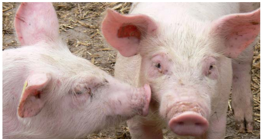
Der Gutsbetrieb Juchhof geht mit der kastrationsfreien Jungebermast mit gutem Beispiel voran.

Die Traubenerträge waren witterungsbedingt recht tief, jedoch von sehr guter Qualität. Damit besteht die berechtigte Hoffnung, am Erfolg des an der Internationalen Weinprämierung Zürich mit dem Silberdiplom ausgezeichneten Jahrgangs 2007 (Pinot Noir, Fassausbau) anknüpfen zu können.