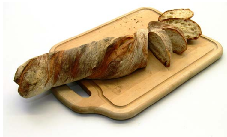
Das Züri-Chorn-Brot ist im ganzen Kanton Zürich erhältlich.

Planung von Grün- und Freiräumen Die Überarbeitung des Inventars der Gartendenkmalpflege ist weitgehend abgeschlossen. Die Weisungen für Entlassungen bzw. Neuaufnahmen liegen im Entwurf vor. Am 11. September 2008 fand in Affoltern die Schlussinformation zum LEK Hönggerberg-Affoltern statt. Im LEK Limmatraum sind bereits 50 Prozent der Massnahmen in der Umsetzungsphase. Da der kantonale Waldentwicklungsplan WEP in Verzug geraten ist, konnte der städtische WEP bis Ende 2008 nicht im Entwurf vorgelegt werden. Der Bericht über die prägenden Freiraumstrukturen der Stadt Zürich liegt im Entwurf vor; die Fertigstellung ist auf Ende Januar