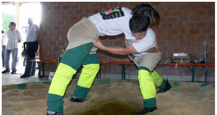
TED-Mitarbeitertag auf dem Juchhof.

Finanzdienste Im Berichtsjahr konnte die SAP-Umstellung erfolgreich abgeschlossen und die Module FI und CO mehrheitlich implementiert werden. Im Herbst 2008 wurde das Projekt SAP-MM gestartet, das vor allem im Bereich der Materialbeschaffung und -bewirtschaftung eingesetzt werden wird.