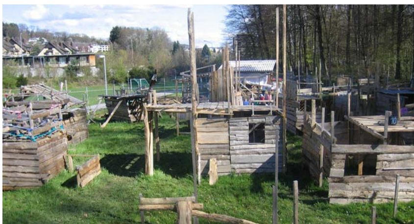
Der Verein Bauspielplatz Rütihütten ist neu Mitglied des VLZ.