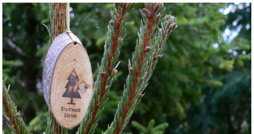
Der selbst geschnittene Frischbaum aus dem Stadtwald.