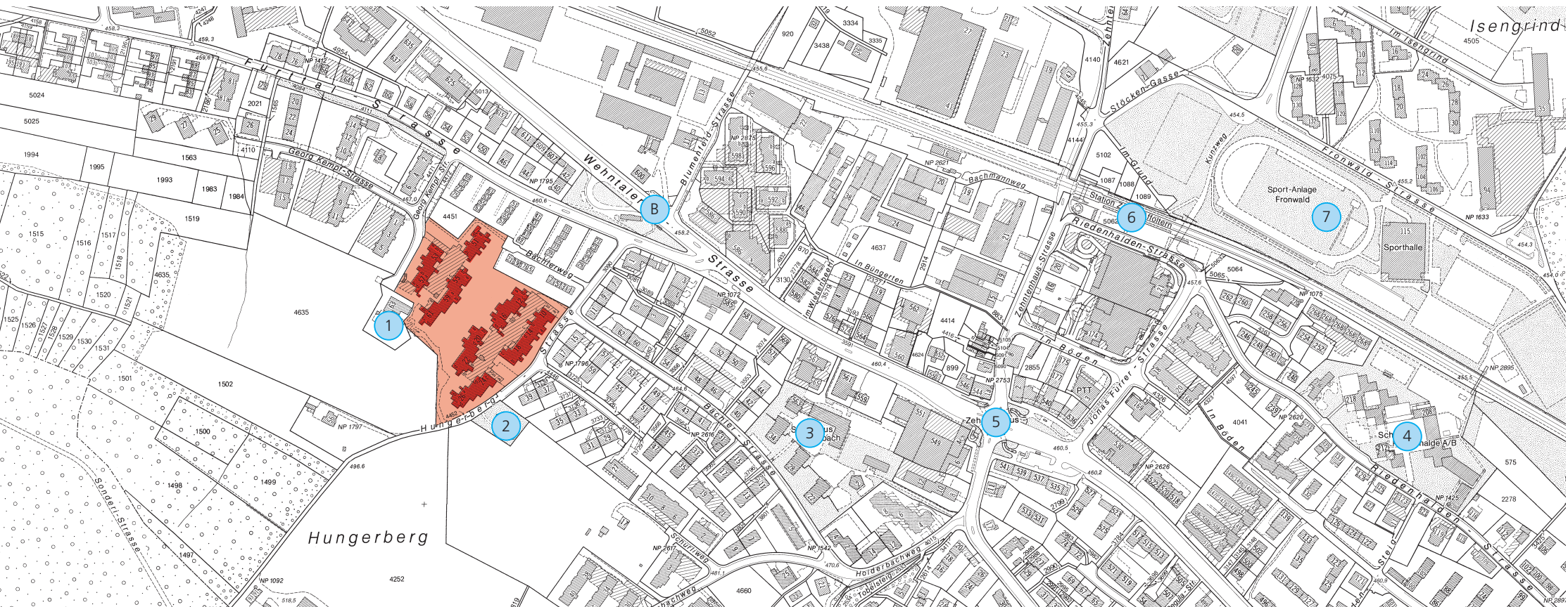
Bewilligung Geomatik + Vermessung Stadt Zürich 1. März 2005