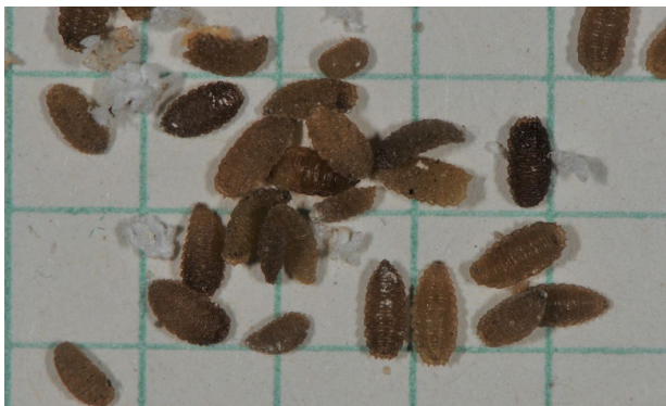
Maden von Buckelfliegen (Larven) auf Rasterpapier 5 mm.