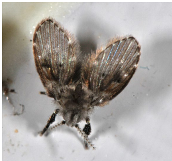
Adulte Schmetterlingsmücken haben typischerweise beschuppte Flügel.

Die 1 bis 5 mm kleinen Mücken ( Psychodidae ) sind am Körper und auf den Flügeln dicht behaart. Sie legen ihre relativ grossen Flügel in der Ruhestellung dachartig über den Hinterleib, was sie wie kleine Schmetterlinge aussehen lässt.