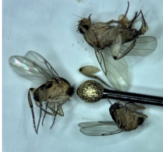
Bild links: Buckelfliegen mit einer Stecknadel zum Grössenvergleich.

Die 3 bis 4 mm kleinen Fliegen (Phoridae) haben einen stark gekrümmten Brustteil, der aussieht wie ein Buckel. Sie können mit Essigfliegen ( Drosophila sp. ) verwechselt werden, haben aber im Gegensatz zu diesen keine roten Augen. Die Artbestimmung sollte von einer Fachperson vorgenommen werden.