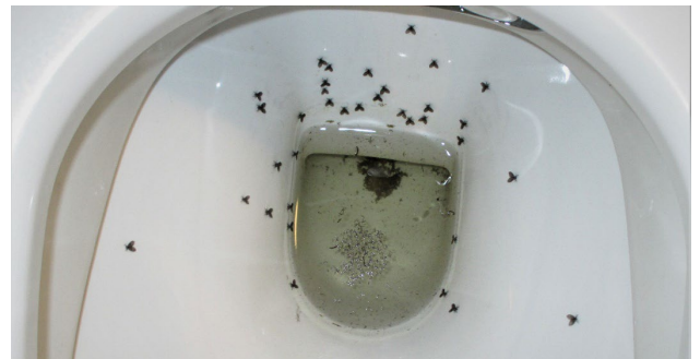
Entwicklung von Schmetterlingsmücken in einem nicht benutzten WC. Im Wasser sieht man Larven, die adulten Schmetterlingsmücken, die in der Toilettenschüssel ruhen, haben die typische Herzform.

Die kleinen Mücken laufen oft an den Wänden von Badezimmern oder Toiletten herum, können aber auch in Räumen mit Abläufen – beispielsweise Kellern – oder schlecht gewarteten Klimaanlageanlagen vorkommen. Sie sind schwache Flieger, aber flinke Läufer. Meist suchen sie windstille Winkel mit hoher Luftfeuchtigkeit auf, werden aber auch von Licht angezogen und finden sich an Fenstern oder den Lichtquellen eines Raumes. Im Freiland findet man sie häufig im Kompost, wo sie organische Stoffe umsetzen und daher sehr nützlich sind.