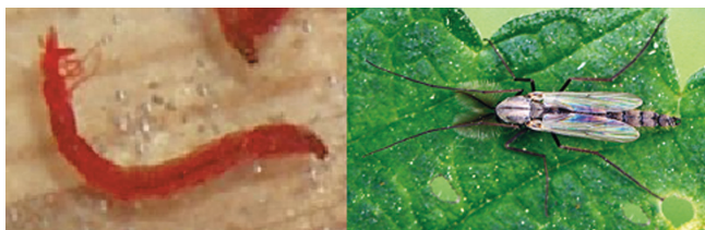
Bild: Zuckmückenlarve und Zuckmücke

Bei den Zuckmücken ( Chironomidae ) handelt es sich um Tiere, die Stechmücken ähnlich sehen, aber meist kleiner sind und nicht stechen können. Ihren Namen haben sie bekommen, weil sie beim Sitzen mit den nach vorne gehaltenen Vorderbeinen zucken.