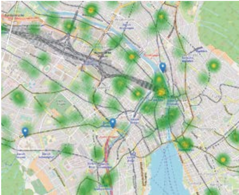
Mögliche Visualisierung von Einsätzen. Blau markiert: Wache Triemli, Wache Süd und Wache Zentrum (v.l.)

SRZ generiert eine Fülle von Daten. Alleine aus dem Einsatzleitsystem resultieren jährlich über 130000 Dispositionen und ein Vielfaches von Datensätzen. Um diese für Auswertungen und Analysen nutzen zu können, hat SRZ ein Datawarehouse aufgebaut.