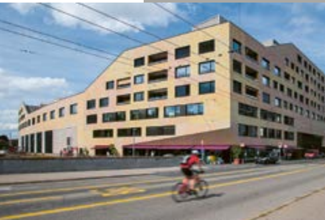
Genossenschaft Kalkbreite

einiges bezüglich Brandschutz zu klären hatte. Zum Beispiel wurden neben konventionellen Wohngemeinschaften auch sogenannte Clusterwohnungen gebaut, die aus einzelnen Wohneinheiten bestanden, die zusammen aber einen einzigen Grosshaushalt bildeten. Die gesetzlichen Vorgaben zu Fluchtwegen oder auch zu Brandabschnittsbildungen waren deshalb nicht so einfach umzusetzen. Viele Gespräche mit Eigentümern, Architekten, Fachplanern, aber auch mit der Gebäudeversicherung Kanton Zürich (GVZ) waren nötig, um gemeinsam Lösungen zu finden. Lösungen waren auch im Zusammenhang mit unterschiedlichen Anforderungen zum Minergie-Eco-Standard und zum Brandschutz gefragt – ein Lernprozess für alle Beteiligten. Auch heute wird die Feuerpolizei immer wieder für Beratungen zu Anliegen der Genossenschaft Kalkbreite angefragt. Denn auch wenn der Bau eines Gebäudes abgeschlossen ist, für die Feuerpolizei geht die Arbeit weiter. ■