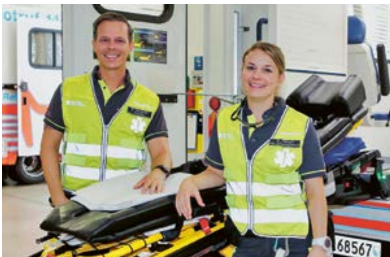
Alle Mitarbeitenden tragen mit einer guten und kundenorientierten Serviceleistung zum Image von SRZ bei.

MS: Auf den ersten Blick haben das Dolder Grand und SRZ vielleicht wenig gemein. In der Hotellerie geht es um Kundenbindung. SRZ möchte natürlich nicht, dass Patienten zu Stammkunden werden. Dennoch gibt es einen gemeinsamen Nenner. Wir möchten zum Beispiel, dass uns ein Spital für seine Patiententransporte als kompetenten und verlässlichen Partner wahrnimmt. Und auch bei uns liegt der Schlüssel zu einer erfolgreichen Dienstleistung in erster Linie bei unseren Mitarbeitenden – jede Einzelne und jeder Einzelne trägt im direkten Kundenkontakt oder mit einer guten Serviceleistung in den rückwärtigen Diensten zum guten Image von SRZ bei.