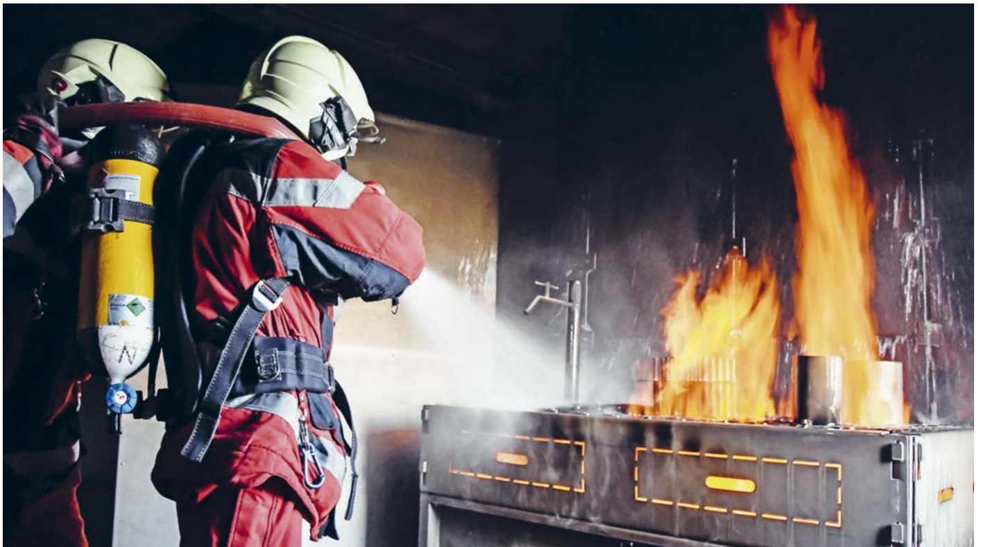
Eine anstrengende Übung – nicht nur körperlich, auch mental –, denn jeder Griff muss sitzen. Und das unter erschwerten Bedingungen: Rund 20 Kilogramm wiegt die persönliche Ausrüstung der Feuerwehrleute mit Atemschutzgerät.

Trupps ein direktes Feedback. Bei Bedarf kann die Sequenz beliebig oft wiederholt werden. «Dies ist