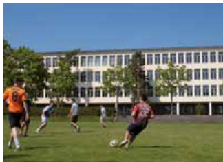
Schul- und Sportanlage Buhnähgel.

Auf dem Buhnähgel sind Bauten aus mehreren Jahrhunderten vereint. Die reformierte Markus-Kirche des Architekten A. H. Steiner besticht als jüngste Anlage (1947) mit dem achteckigen Zentralbau unter einem «Zeltdach». Von hier aus hat man eine herrliche Aussicht über Zürich-Nord. Die Turmbesteigung wird mit einem spektakulären Weitblick belohnt (Anmeldung Tel. 043 495 90 55). Weiter gelangt man zum Schulhaus Buhnähgel, welches der Architekt Roland Rohn neben das altherwürdige Schulhaus Buhn baute. Das Schulhaus Buhnähgel ist ein baukünstlerisch wertvolles Beispiel des «Neuen Bauens». Sonntags trifft sich auf den grosszügigen Aussenanlagen Jung und Alt zu geselligem Sport und Spiel. Am Buhnähgel stehen das denkmalgeschützte Flarzhäuser aus dem 15. Jahrhundert als eines der ältesten Bauernhäuser der Stadt und das villenartige, detailreiche Mehrfamilienhaus von 1897 aus rotem Backstein.