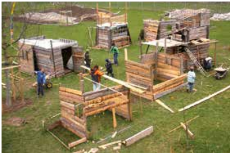
Abenteuerspielplatz auf der Schwandenwiese.

Weiter in Richtung Waldrand hört man es seit 2006 hämmern, sägen und krachen aus der eigenwilligsten und kreativsten Holz-Sand-Wasser-Siedlung im Quartier: dem Abenteuerspielplatz Buntspecht. Der Spielplatz ist kein gewöhnlicher mit den üblichen Spielgeräten. Hier werken die Kinder selbst! Sie verwenden unterschiedliche Materialien und Werkzeuge, lernen einander kennen und schätzen beim gemeinsamen Bauen, Planen, Bräteln und gemütlichen Zusammensitzen. Drei Spielplatzleitende und Freiwillige begleiten die Kinder in ihren Ideen.