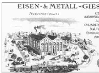
Briefkopf der Eisen- und Metallgieesserei Seebach von 1902, Gauss-Areal.