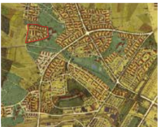
Plan A. H. Steiner, Nachträge 1948–1955.

Nach der Eingemeindung von 1934 galt es, die neuen Stadtteile sorgfältig zu planen. Dazu wurde von Stadtbaumeister A. H. Steiner ein Siedlungs- und Grünraumkonzept entwickelt, das die Grundlage für die 1000 Wohnungen bildete, welche die Genossenschaften bis 1950 bauten. Gut erkennbar ist der Schönauring, sowohl im alten wie auch im Plan aus jüngster Zeit. Der Arbeiterschicht aus den Kreisen 4 und 5 wollte man das Wohnen im Grünen ermöglichen. Die grosszügigen Grünräume zwischen den Siedlungen sind weitgehend erhalten. Die meisten Siedlungen aus den Vierzigerjahren werden heute dichter und mit grossflächigeren Wohnungen neu gebaut.