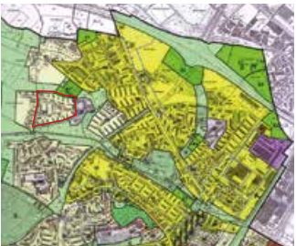
Zonenplan Stadt Zürich.