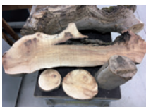
Mit Masaria befallenes Holz der Platane.

Platanen werden leider in Zürich von Masaria , einer Pilzkrankheit, befallen. Arm dicke Äste können innerhalb weniger Monate absterben und abbrechen. Um die Sicherheit zu gewährleisten, werden Platanen auf öffentlichen Plätzen mehrmals jährlich kontrolliert. Weil sich der Befall nur auf der Oberseite der Äste bemerkbar macht und vom Boden aus nicht sichtbar ist, klettern Spezialistinnen und Spezialisten in die Baumkrone, um zu prüfen, ob der Baum von Schädlingen oder Krankheiten befallen ist und ob es Stabilitätsprobleme gibt. Je nach Befund werden Äste entfernt und die Krone entlastet. Bei besonders wertvollen Bäumen werden Äste mit Stahltrössen gesichert. Im schlimmsten Fall muss der Baum gefällt und ein neuer gepflanzt werden.