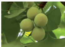
Früchte eines weiblichen Ginkgos.

Der Ginkgo gehört nach dem von Darwin eingeführten Terminus zu den lebenden Fossilien. Weder Nadel- noch Laubbaum, bildet der Ginkgo eine eigene Klasse, jene der Ginkgoopsida. Der Ginkgo ist zweihäusig, d.h., es gibt männliche und weibliche Pflanzen. Die beiden Bäume hier sind weiblich, was im Herbst an ihren Früchten ersichtlich ist. Die reifen Früchte verströmen einen unangenehmen Geruch nach Buttersäure. Die beiden Ginkgos wurden in den letzten Jahren des 19. Jahrhunderts gepflanzt, als das Landesmuseum gebaut wurde. Beim Bau der Museumserweiterung 2012 mussten sie massive Eingriffe im Wurzelraum hinnehmen. Ebenso hat sich der sonnige Standort in einen schattigen verwandelt. Doch die Bäume zeigen sich noch immer vital und machen ihrem Ruf als zähe, lebende Fossilien alle Ehre.