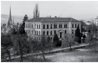
Das Gebäude um 1910 mit den damals noch jungen Mammutbäumen.

Die beiden Mammutbäume, in der Sierra Nevada (Kalifornien) heimisch, begleiten das imposante Gebäude. Dieses wurde 1885 von Otto Weber, einem Schüler Gottfried Sempers, gebaut. Zu jener Zeit wurden auch die Riesenmammutbäume gepflanzt. Der rechte Baum steht immer noch, er ist mittlerweile 30 Meter hoch. Der linke Baum und dessen Wurzeln wurden bei Bauarbeiten beschädigt, worauf er zu stark in Schräglage kam und aus Sicherheitsgründen gefällt werden musste. An seiner Stelle wurde 2010 ein neuer Mammutbaum gepflanzt.