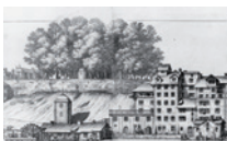
Lindenhof, 1770.

Der Lindenhof ist die älteste öffentliche Grünanlage der Stadt, seine Geschichte reicht zurück bis in keltische Zeiten. Die Bepflanzung mit 52 Linden wurde erstmals 1422 erwähnt. Schon im Mittelalter traf sich die Bevölkerung unter den Linden zum geselligen Beisammensein, aber auch zu politischen Versammlungen. Bis auf eine alte Kastanie wachsen hier auch heute noch ausschliesslich Linden.