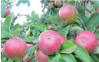
Apfelsorte Edelchrüsler.

Der Rechberg ist ein Gartenkmal aus dem Spätbarock (ca. 1760), das noch immer in seiner Ursprungsform gepflegt wird. Die heimischen Eiben sind in Form geschnitten, an den Mauern wächst Spalierobst und die Wiesen sind mit Obstbäumen bepflanzt. Die verschiedenen Arten und Sorten der Obstbäume zeigen die Wahlmöglichkeiten bei unterschiedlichen Platzverhältnissen oder Geschmacksvorlieben: vom Spalierbaum für die Fassade bis zum Hochstamm für den grossen Garten, von der Apfelsorte «Edelchrüsler» bis zur «Hauszwetschge Rinklin». Das breite Sortenspektrum leistet einen Beitrag zum Erhalt der natürlichen Vielfalt. Zudem profitieren Menschen und Tiere von der Blütenpracht und den Früchten.