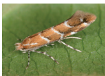
Erwachsene Miniermotte.

Am Neumühlequai wachsen Rosskastanien, so weit das Auge reicht. Die Art stammt ursprünglich aus Südosteuropa. Sie ist anfällig auf die Rosskastanienminiermotte. Die Larven dieser Insekten «minieren», d.h., sie fressen Gänge zwischen der Ober- und der Unterseite der Blätter, wodurch unschöne braune, längliche Flecken entstehen. Die Tiere überwintern als Puppen im Falllaub und verwandeln sich anschliessend in die Falter. Um den Befall einzudämmen, ist es wichtig, im Herbst das Laub zusammenzukehren und wegzuführen. An einzelnen Bäumen wurden Nistkästen für Meisen aufgehängt. Die Vögel verspeisen die Miniermotten. Erste Beobachtungen zeigen eine positive Wirkung.