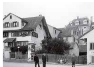
Baschligplatz, 1914.

Rund um den Baschligplatz stehen alte Häuser in Riegelbauweise, die zum Kern der ehemaligen Gemeinde Hottingen gehören. Den Namen erhielt der Platz vielleicht wegen den gelegentlichen Überschwemmungen mit Schlamm durch den Wolfbach im Sinne von «Bachschliff-Platz» oder ähnlich.