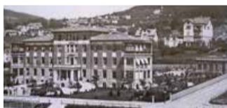
Schweizerische Pflegerinnenschule mit Frauenspital.

Die ehemalige Pflegerinnenschule an der Samariterstrasse wurde im Jahr 1901 eröffnet. 1934 und 1940 wurde die «Pflegeri» erweitert. Sie blieb während rund 100 Jahren im wahrsten Sinne ein Werk «von Frauen für Frauen». 2002 wurde die «Pflegeri» teilweise durch einen Neubau mit Wohnungen und Büros ersetzt.