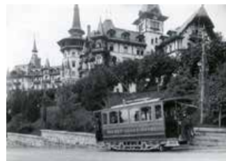
Privattram vor dem Dolder, 1911.

Das Reservoir der Wasserversorgung Zürich wurde von 1960 an in Etappen erbaut. Hier wird das Wasser der vielen Quellen im Waldgebiet Dolder bis zum Degenried gesammelt und mit Seewasser vermischt. Separate Leitungen mit Quellwasser speisen viele Trinkbrunnen der Stadt, die im Bedarfsfall als Notbrunnen dienen können.