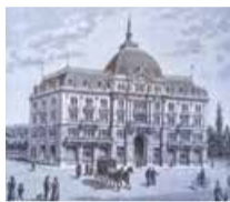
Römerhof um 1900.

Von 1851 bis 1897 stand hier der Bauernhof der Familie Römer mit einer Wirtschaft. Daneben baute man die Talstation für die 1895 eröffnete Drahtseilbahn, die zum Waldhaus Dolder hinaufführte. 1898 wurde der palastartige Römerhof als Hotel für den Pfauenwirt und Dolder-Initiaten Heinrich Hürlimann erbaut und die Talstation eingebaut. 1981 wurde das Innere des Gebäudes zu einer Filiale der Schweizerischen Bankgesellschaft, der späteren UBS, umgebaut. Direkt beim Römerhofplatz an der Klosbachstrasse 88 ist eine Gedenktafel angebracht für zwei berühmte Bewohner: für den Nobelpreisträger Elias Canetti und den Schriftsteller Kurt Gugenheim. Canetti wohnte und arbeitete von 1972 bis 1994 in diesem Haus, Gugenheim von 1963 bis 1966. Angebaut ist das 1897 erbaute Römerschloss, ein herrschaftliches Miethaus.