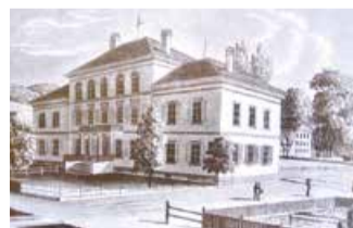
Gemeindehaus Hottingen um 1850; 1820 als erstes Gemeindeschulhaus errichtet.

1820 als erstes eigenes Hottinger Schulhaus erbaut, neben der Wirtschaft Rosengarten. Vorher war das Schulzimmer im oberen Stock des Wirtshauses angesiedelt, wo ein Lehrer eine Schar Kinder verschiedenen Alters lesen und schreiben lehrte. Aber Wirtshaus und Schulhaus gingen schlecht zusammen. Später wurde das Schulhaus mit Anbauten sowie einem Singsaal erweitert. Heute beherbergt es das Kreisbüro Hottingen, den Polizeiposten, das Büro des Gemeinschaftszentrums sowie den Hottinger Saal.