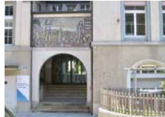
Ehemaliges Pestalozzi-Schulhaus. Über dem Haupteingang ein Wandbild, Pestalozzi darstellend mit Kindern.

Das kantonale Labor wurde 1913 als privates Pestalozzi-Schulhaus erbaut. Die Eingangshalle enthält zwei abstrakte Wandbilder, die ersten dieser Art in Zürich, von Hans Arp (rechts) und Otto van Rees von 1915. Wegen Nicht-Gefallens wurden sie 1918 übermalt und erst 1974 wiederentdeckt. 1925 folgte der Umbau zum kantonalen Labor. Damit Lebensmittel sicher und Gebrauchsgegenstände verlässlich sind, kontrolliert das kantonale Labor Betriebe sowie das Trink- und Badewasser. Weiter untersucht es Waren aus Produktion und Handel.