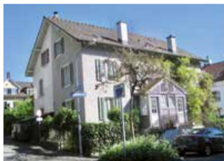
Siedlung Aktienhäuser, Viertelhaus, erbaut 1875/1878.

Die Aktienhäuser wurden als Wohneigentum für Arbeiter*innen von 1873 bis 1889 in vier Etappen erbaut. Angeregt wurde der Bau durch Johann Heinrich Fierz, einem Zürcher Textilindustriellen und Nationalrat. Es gab 100 Wohnungen in acht verschiedenen Haustypen, darunter die drei einzigen «Viertelhäuser» in der Schweiz an der Fichtenstrasse, erstellt nach Vorbildern in der Cité ouvrière in Mülhausen im Elsass.