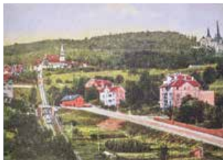
Blick vom Römerhof aufwärts. Das erste grosse Haus rechts ist jenes der Familie Righini.