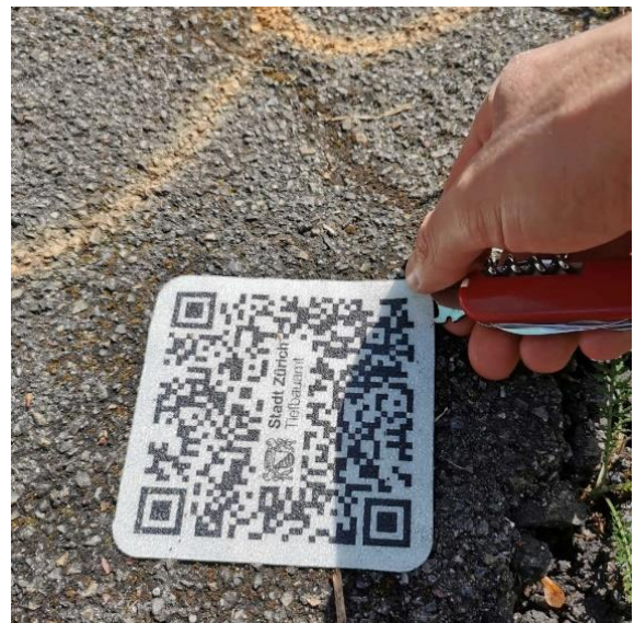
Abb. 4: Entfernung QR-Kleber mit Taschenmesser