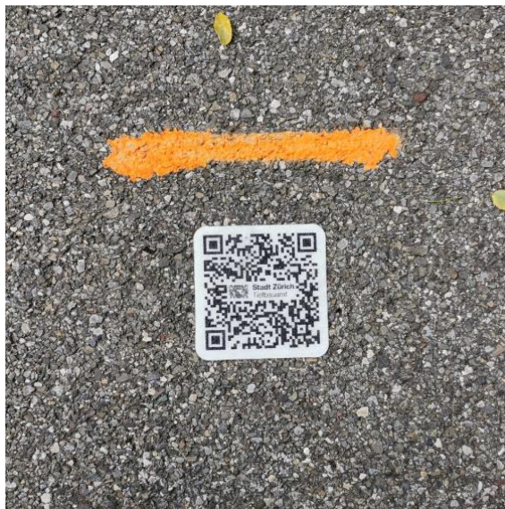
Abb. 3: Beispiel auf Asphalt