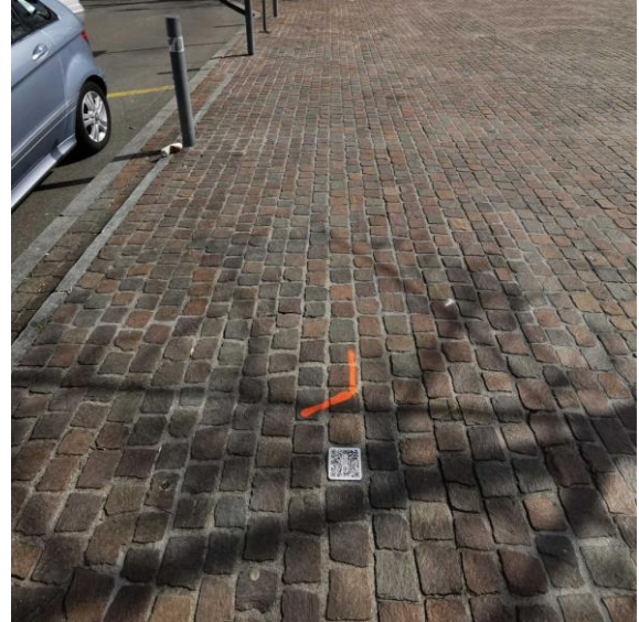
Abb. 2: Beispiel auf Pflasterung