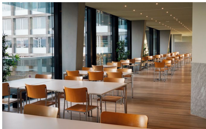
5 | Restaurant Triemli (inkl. Essensausgabe) Bis 480 Sitzplätze