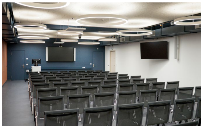
2 | Konferenzsaal Bis 80 Sitzplätze