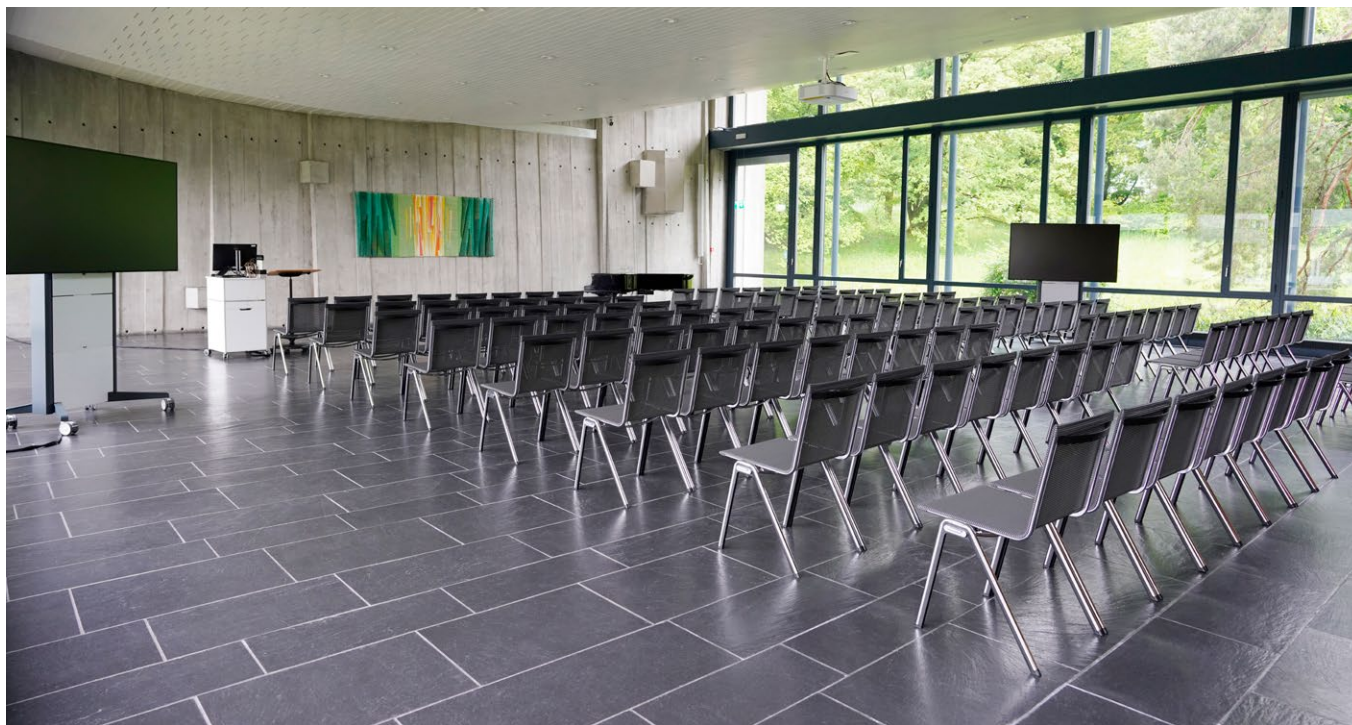
1 | Festsaal Bis 200 Sitzplätze