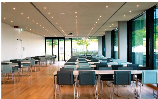
4 | Restaurant Triemli (hinterer Bereich) Bis 380 Sitzplätze