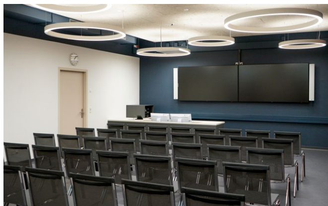
3 | Konferenzsaal Bis 40 Sitzplätze