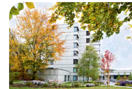
Pflegezentrum Witikon Kienastenviesweg 2 8053 Zürich