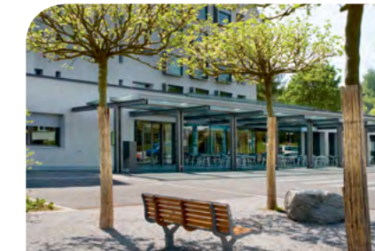
Pflegezentrum Entlisberg Paradiesstrasse 45 8038 Zürich