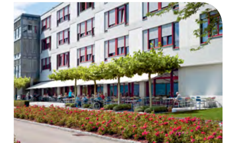
Pflegezentrum Käferberg Emil-Klöti-Strasse 25 8037 Zürich