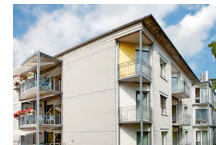
Tageszentrum Riesbach Witellikerstrasse 19 8008 Zürich