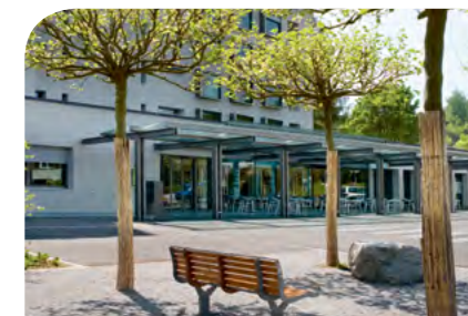
Tageszentrum Entlisberg Paradiesstrasse 45 8038 Zürich