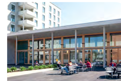
Tageszentrum Mattenhof Helen-Keller-Strasse 12 8051 Zürich