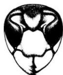
Hornisse ( Vespa crabro )