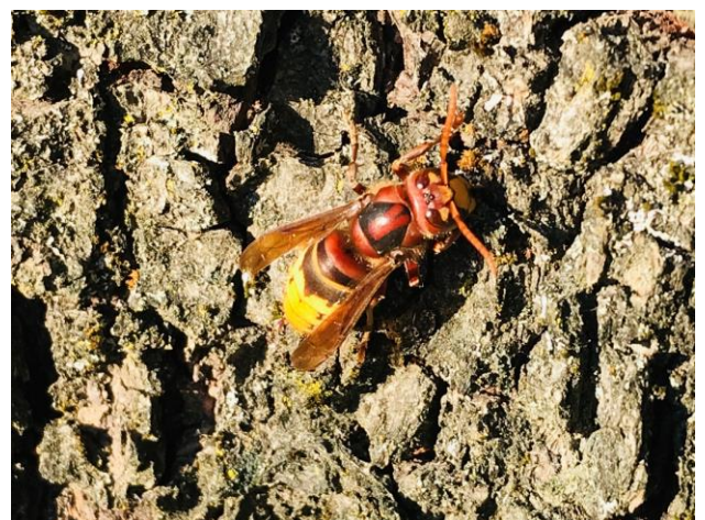
Hornisse mit der typischen braunrot-schwarzen Färbung auf Brustteil und Kopf.

Bedroht. In Deutschland (wie alle anderen Wespen ausser den Deutschen und Gemeinen Wespen) geschützt. Standort des Nestes wie Gemeine und Deutsche Wespe. Volksstärke: 100 bis 700 Tiere. Hornissen sind nicht aggressiv. Ein Hornissenstich ist nicht schmerzhafter oder giftiger als ein Wespenstich. Probleme treten wie bei den anderen Wespen nur bei Allergikern auf. Nester möglichst nicht zerstören, Umsiedlung des Nestes in Betracht ziehen.