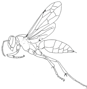
Feldwespe im Flug

Feldwespen ( Polistinae ) sind wie die anderen Wespenarten schwarz-gelb gefärbt. Die Arbeiterinnen sind bis 15 mm lang, die Königinnen bis 18 mm. Die Beine sind im Gegensatz zu den anderen heimischen Wespen auffallend verlängert, was ihnen beim Fliegen ein unverwechselbares Aussehen gibt (siehe Bild).