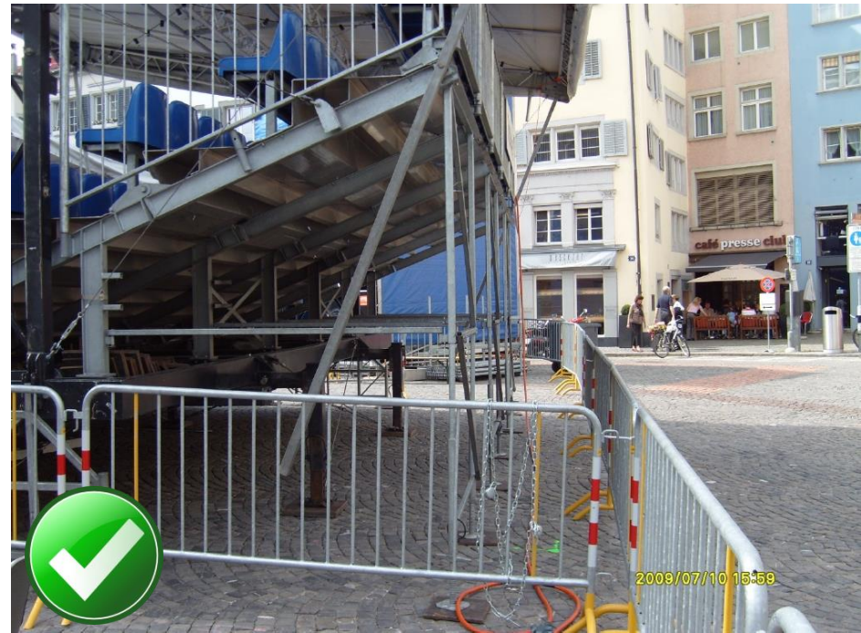
Abgesperrte Bereiche unterhalb von Tribünen