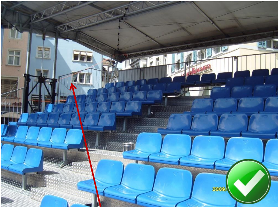
Zuschauertribüne mit Geländer