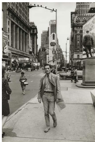
N° 1 Pier Paolo Pasolini in New York, 1966

Verwendung der Bilder erlaubt nur im Zusammenhang mit der Ausstellung im Museum Strauhof.