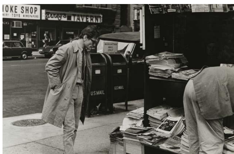
N° 8 Pier Paolo Pasolini in New York, 1966