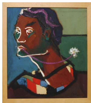
N° 12 Pier Paolo Pasolini, Selbstportrait mit altem Schal, 1946 42.8 x 38 cm, Öl auf Hartfaserplatte