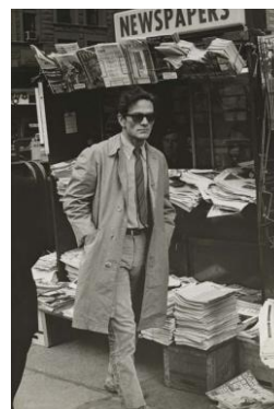
N° 9 Pier Paolo Pasolini in New York, 1966