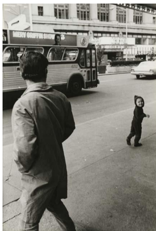
N° 2 Pier Paolo Pasolini in New York, 1966