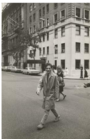
N° 5 Pier Paolo Pasolini in New York, 1966