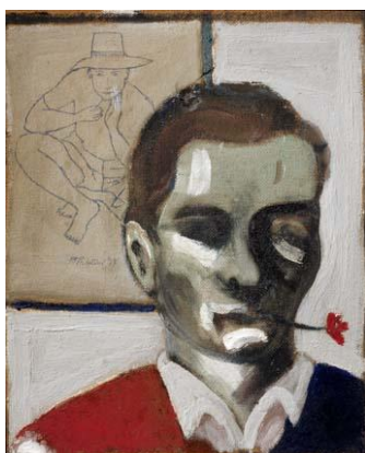
N° 11 Pier Paolo Pasolini, Selbstportrait mit Blume im Mund, 1947 42.5 x 34.5 cm, Öl auf Hartfaserplatte