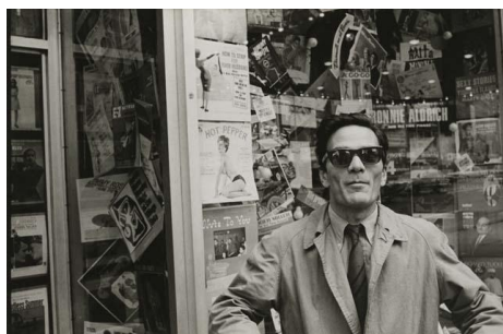
N° 7 Pier Paolo Pasolini in New York, 1966