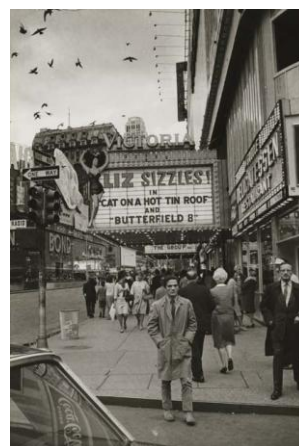
N° 6 Pier Paolo Pasolini in New York, 1966