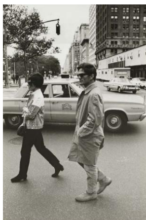
N° 4 Pier Paolo Pasolini in New York, 1966