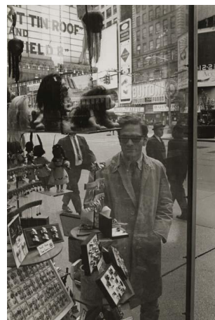
N° 3 Pier Paolo Pasolini in New York, 1966