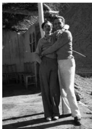
Buch Seite 213 AS und CC.jpg