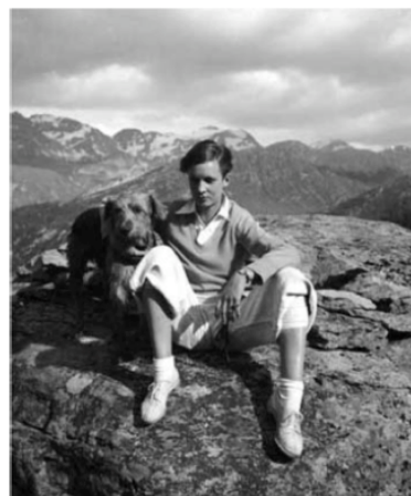
Buch Seite 264