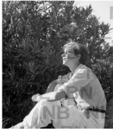
Buch Seite 347