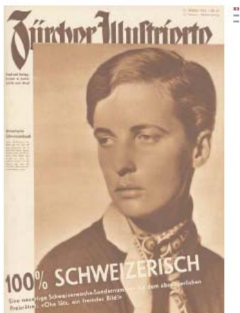
8) Annemarie Schwarzenbach auf dem Cover der Zürcher Illustrierten, 27. Okt. 1933 Anlass war der Beginn ihrer ersten Orientreise