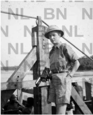
Buch Seite 317