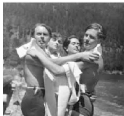
7) Klaus Mann, Annemarie Schwarzenbach, Erika Mann und ein Unbekannter Walchensee, 1932