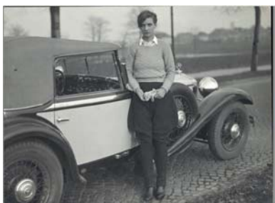
5) Annemarie Schwarzenbach und ihr Mercedes Mannheim, Berlin 1932