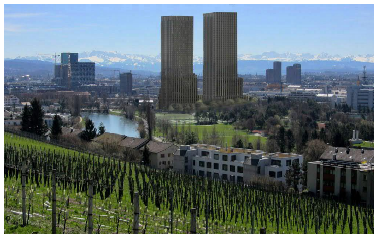
Abbildung 1: Anhang zur Einwendung, Visualisierung «Aussicht von Kirche Höngg, nachher»

Dem Einwendungsschreiben sind Visualisierungen beigelegt, welche aufzeigen sollen, dass die geplanten Hochhäuser die Aussicht von Höngg auf Stadt, See und Berge versperren würden. Folgende Abbildung zeigt gemäss Einwendung den Blick von der Kirche Höngg.