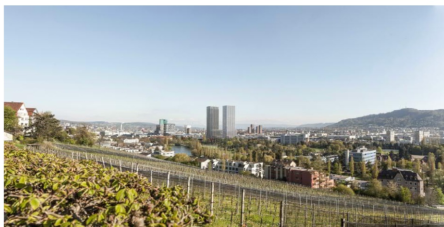
Abbildung 3: Foto/ Visualisierung Richtprojekt, Standort Kirche Höngg.

Abbildung 3 zeigt gemäss Bauherrschaft die tatsächliche, unveränderte Perspektive vom in der Einwendung angegebenen Standort Kirche Höngg. Es wird erkennbar, dass in der Visualisierung der Einwendung das Blickfeld verengt und der Bildausschnitt vergrössert wurde. Dieses Bild (Abbildung 3) entspricht der Aussicht vom Standort Kirche Höngg nach Realisierung des beabsichtigten Projektes.