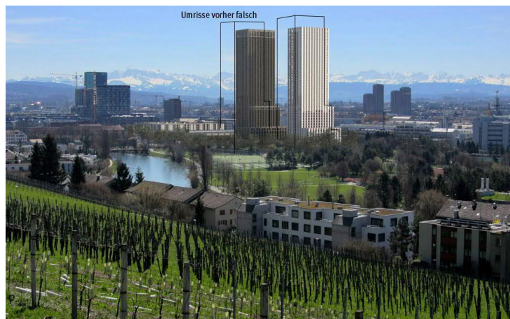
Abbildung 2: Durch Bauherrschaft korrigierte Darstellung der Visualisierung aus der Einwendung in Bezug auf das Volumen.

Bei der Darstellung aus der Einwendung (Abbildung 1) wurde gemäss Überprüfung durch die Bauherrschaft sowohl die Perspektive als auch die Darstellung der Hochhäuser stark verändert. Nachfolgende Abbildung 2 ist eine von der Bauherrschaft korrigierte Darstellung der Visualisierung aus der Einwendung in Bezug auf das tatsächlich beabsichtigte Volumen der Hochhäuser. Darin schwarz umrandet ist die nicht den geplanten Gebäuden entsprechende Silhouette gemäss der Visualisierung aus der Einwendung. Die Dimensionen des Richtprojekts zum Gestaltungsplan sind deutlich schmäler als jene der Visualisierung der Einwendung.