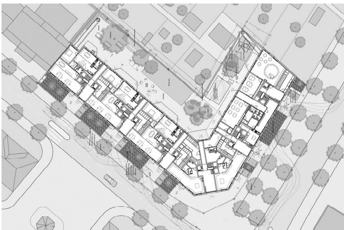
Situationsplan Erdgeschoss und Umgebung

Aufgrund der eingeschränkten Platzverhältnisse können die Kinder der Wohnsiedlung die Spielfläche des Kindergartens ausserhalb der Betriebszeiten mitbenutzen. Umgekehrt steht die Aussenfläche der Wohnsiedlung aufgrund der besseren geografischen Orientierung (Besonnung) auch zur Mitbenutzung für den Kindergarten zu Verfügung.