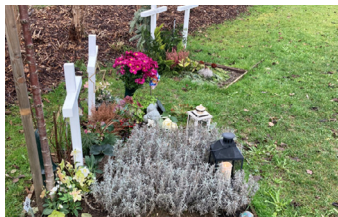
Caveau pour enfants: Enterrement/Inhumation des cendres