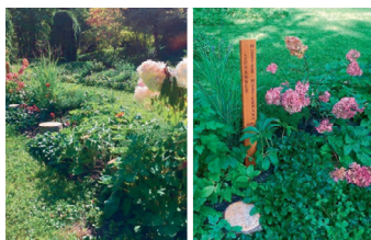
Caveau à thème à concession: Inhumation des cendres