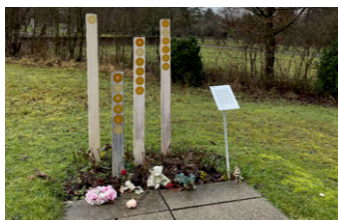
Caveau commun musulman pour les tout-petits au cimetière de Witikon: enterrement avec cercueil 30 cm max. (pour les enfants mesurant moins de 27 cm)